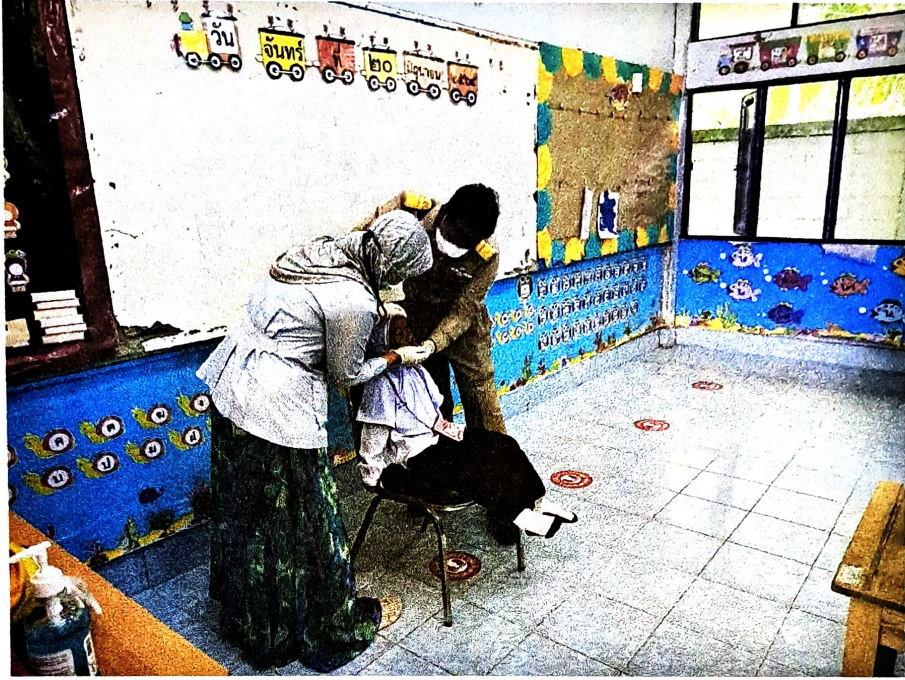
เจ้าหน้าที่โรงพยาบาลส่งเสริมสุขภาพตำบลยะลาทำการตรวจ ATK ให้กับนักเรียน