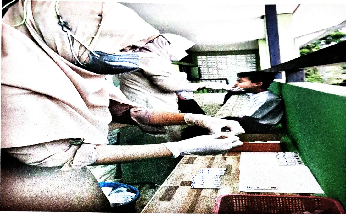
ครูโรงเรียนบ้านป่าโจทำการตรวจ ATK ในชั้นประถมศึกษาปีที่ ๕