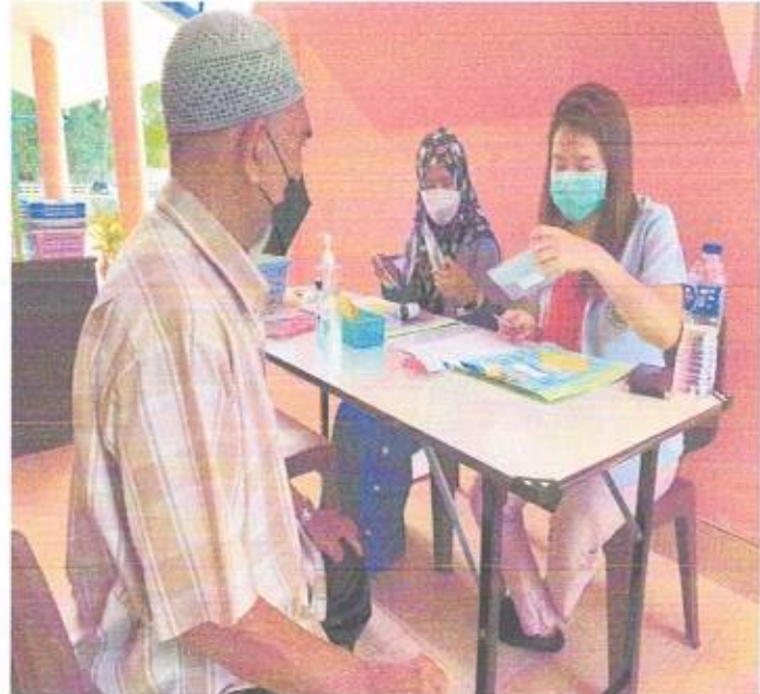
ดูแลผู้ป่วยโรคเบาหวาน-ความดันโลหิตสูงโดยทีมสหวิชาชีพจาก รพ.สตูล