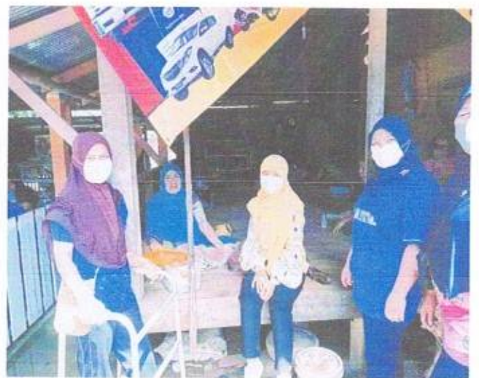
เยี่ยมบ้านผู้ป่วยโรคไม่ติดต่อเรื้อรัง (ความดันโลหิตสูง-เบาหวาน)