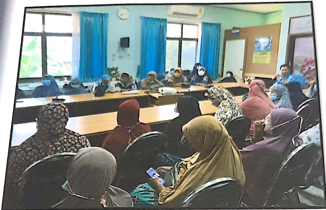
รูปภาพโครงการส่งเสริมสุขภาพผู้สูงอายุ "สุขภาพดี ชีวิตมีความสุข" ประจำปี 2566