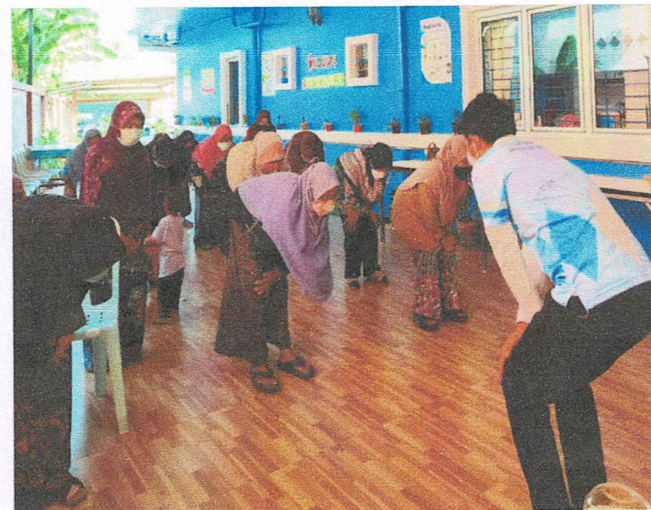
ฐานที่ 2 ฝึกปฏิบัติการออกกำลังกาย และ ฐานที่ 3 การผ่อนคลายความเครียด