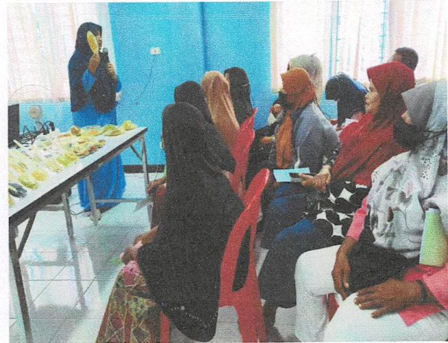
ฐานที่ 1 ให้ความรู้เรื่องอาหารเพื่อสุขภาพและ Model อาหาร