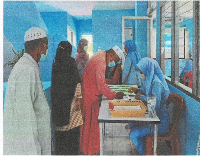
ลงทะเบียน,แจกคู่มือดูแลสุขภาพกลุ่มเสี่ยง,ให้ความรู้เรื่องโรคไม่ติดต่อเรื้อรังและการปฏิบัติตัว