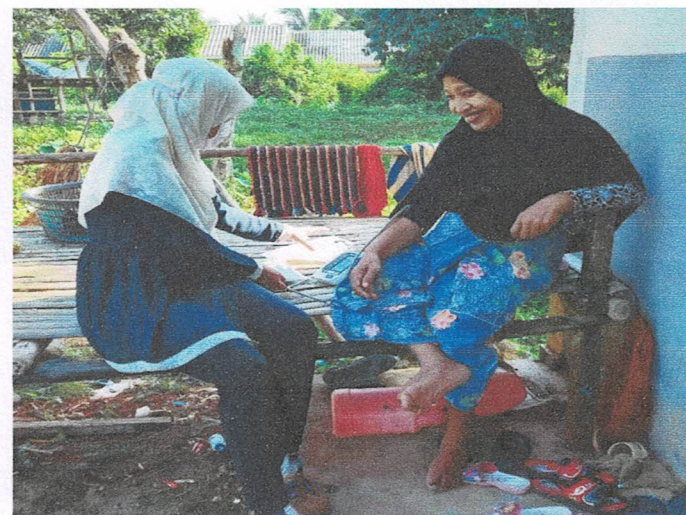
เยี่ยมบ้านผู้ป่วยเรื้อรังที่มีปัญหาสุขภาพ (CKD, น้ำตาลโคเลสเตอรอลสูง, ความดันโลหิตสูง, ผู้พิการ, ผู้ป่วยติดบ้านช่วยเหลือตัวเองได้น้อย