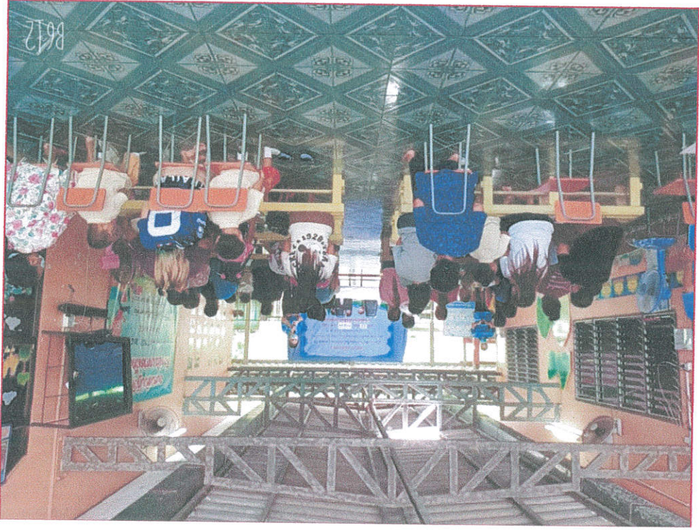
ស្ថានភាព គម្រោងបណ្តុះបណ្តាល គណៈកម្មាធិការ ៧១ ២៤២១ ខេត្តកោះកុង ក្រុងកោះកុង ខណ្ឌកោះកុង ក្រុងកោះកុង ខេត្តកោះកុង ក្រុងកោះកុង (៧១-៧៤២១) ខេត្តកោះកុង ក្រុងកោះកុង ខណ្ឌកោះកុង ក្រុងកោះកុង ខេត្តកោះកុង ក្រុងកោះកុង