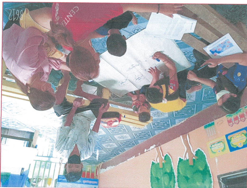
៧៤៧១ រោងចក្រ ៣៣ ក្រុង ៧១ ៧២ ៧៣ ៧៤ ៧៥ ៧៦ ៧៧ ៧៨ ៧៩ ៨០ ៨១ ៨២ ៨៣ ៨៤ ៨៥ ៨៦ ៨៧ ៨៨ ៨៩ ៩០ ៩១ ៩២ ៩៣ ៩៤ ៩៥ ៩៦ ៩៧ ៩៨ ៩៩ ១០០ កិច្ចការសង្គមស្របច្បាប់សម្រាប់កុមារដែលរងផលប៉ះពាល់ពីជំងឺកូវីដ-១៩ (covid-19)