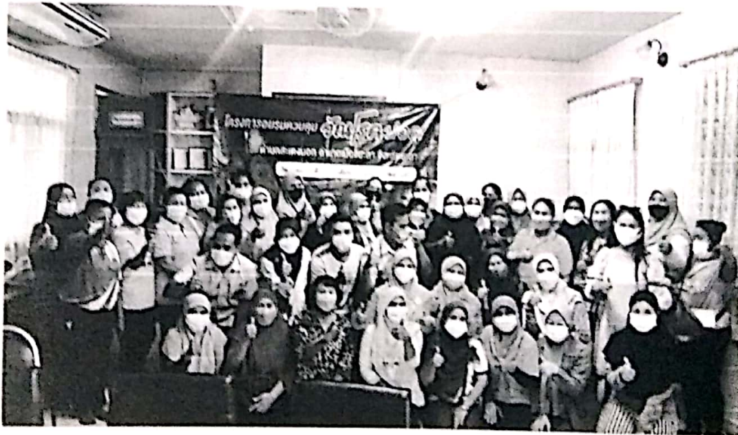
ภาพกิจกรรม ถ่ายภาพร่วมกันระหว่างผู้จัดอบรม และผู้เข้าอบรม