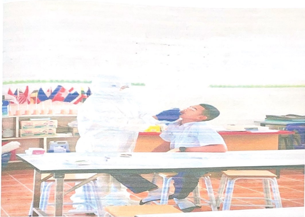
รูปภาพโครงการคัดกรองผู้มีความเสี่ยงในการติดเชื้อไวรัสโคโรนา ( Covid-19) โรงเรียนบ้านดาหล้า