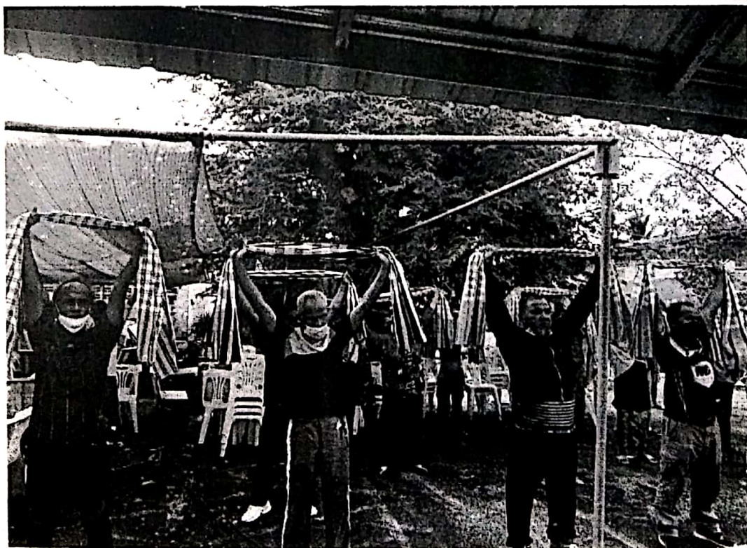
สาธิตวิธีการออกกำลังกายโดยใช้ผ้าขาวม้า