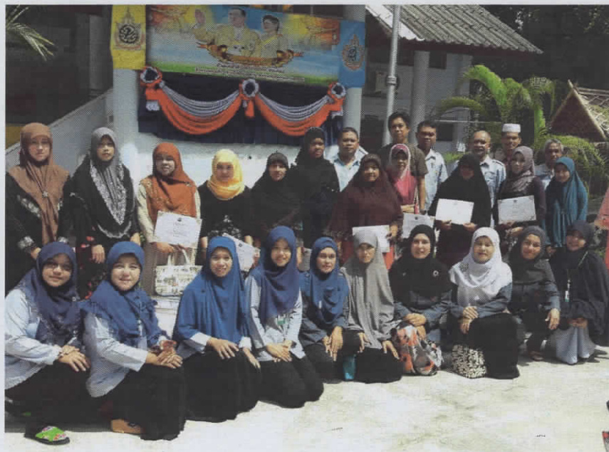
ประกวดบ้านสะอาด