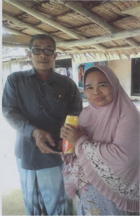
สำรวจบ้าน กำจัดลูกน้ำยุงลาย มอบยาพ่นยุงแก่บ้านที่พบผู้ป่วย