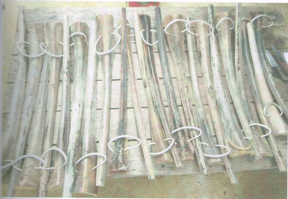
ทางมะพร้าวใช้ในการออกกำลังกาย