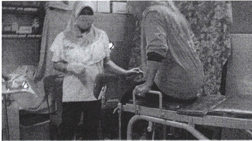
เข้าห้องตรวจ