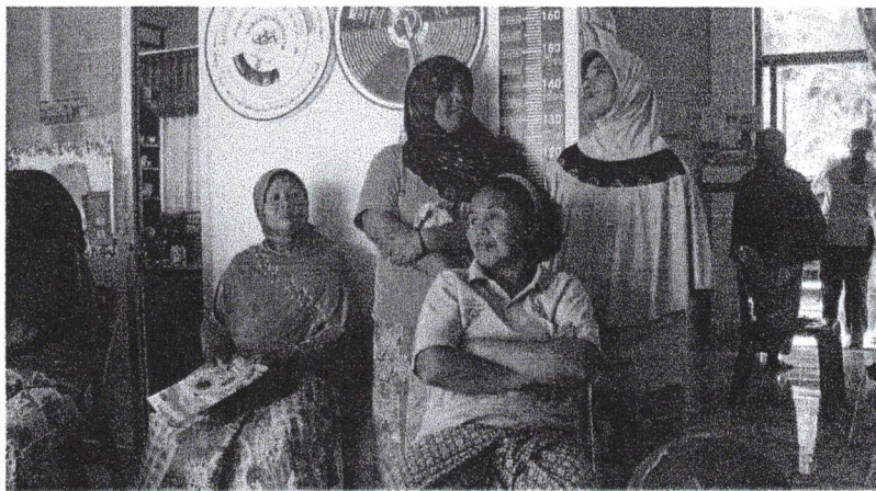
นั่งรอรับบริการ