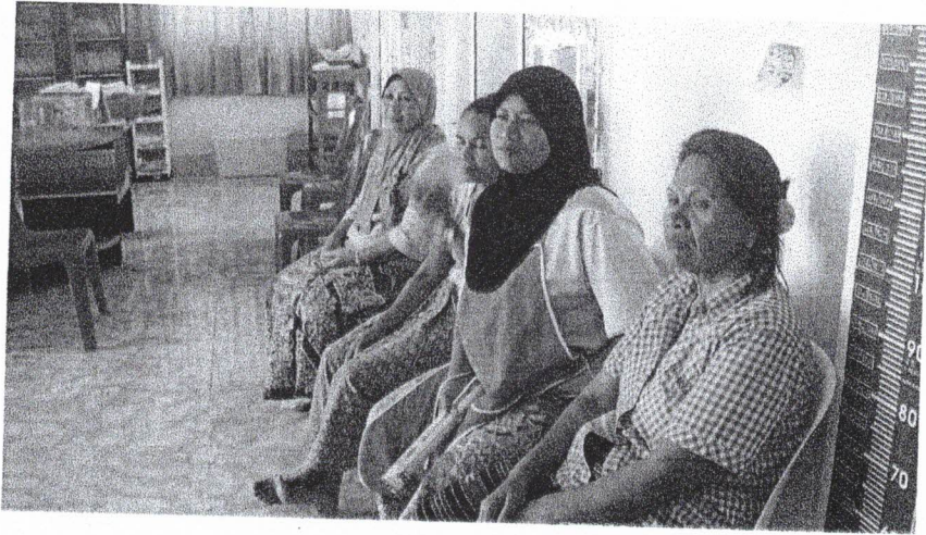
รอคิวเข้าห้องตรวจ