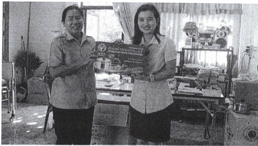
ตรวจเสร็จรับของที่ระลึก