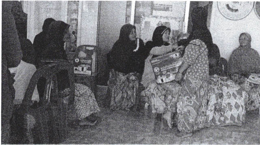
นั่งรอซักประวัติเพื่อรับการตรวจมะเร็งปากมดลูก