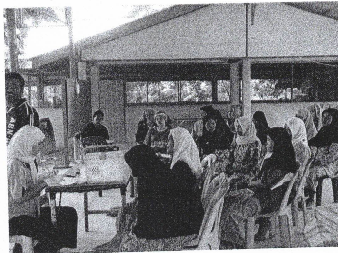
อสม.ร่วมกับเจ้าหน้าที่สาธารณสุขร่วมกันรณรงค์ออกตรวจคัดกรองโรคเบาหวาน ความดันโลหิตสูงในหมู่บ้าน