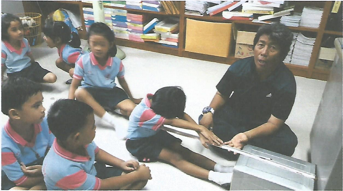
นั่งจ่อตัวไปข้างหน้า ทดสอบความอ่อนตัว