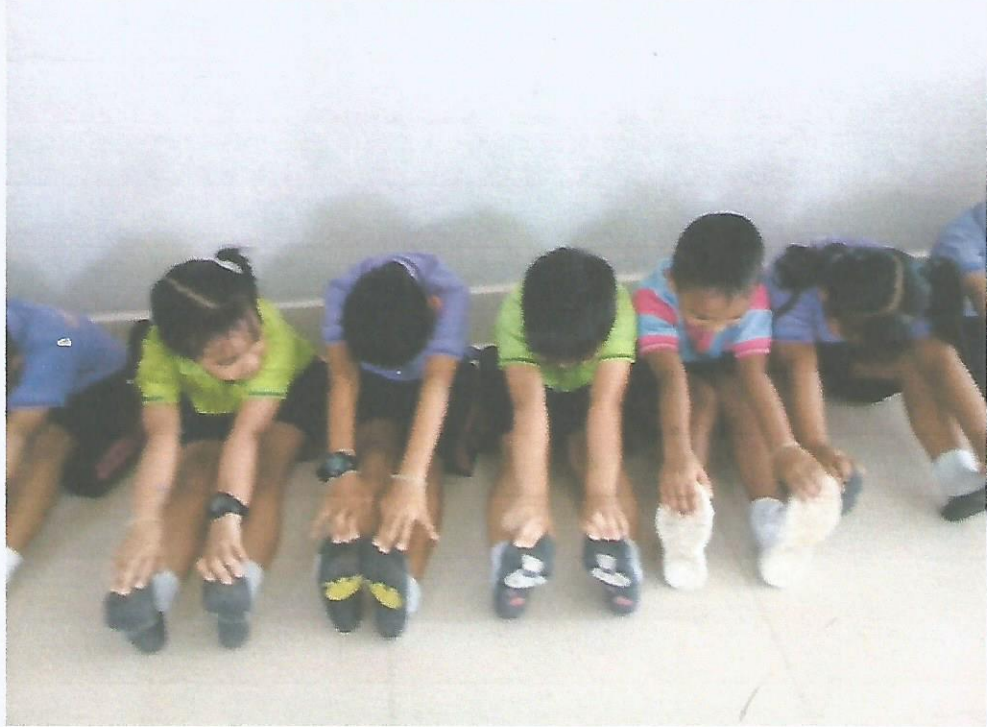
ทดสอบการทรงตัว