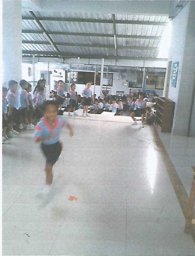
วัดความเร็ว ความคล่องตัว