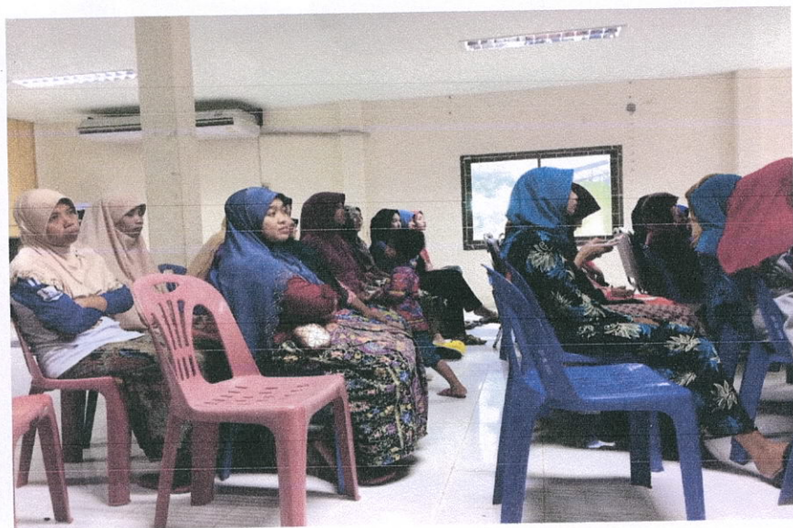
การอบรมให้ความรู้เรื่องมะเร็งปากมดลูกและมะเร็งเต้านม