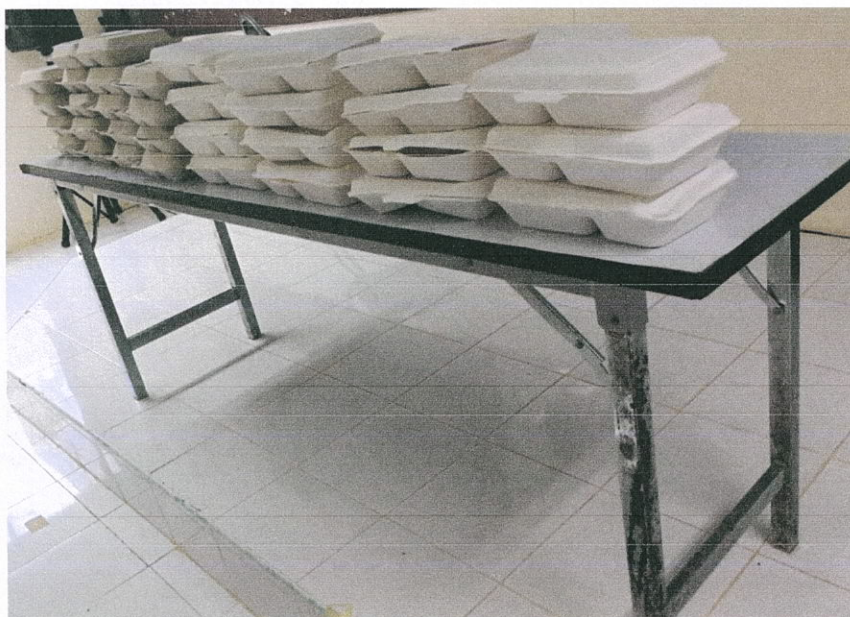
อาหารว่าง เครื่องดื่มและอาหารกลางวัน