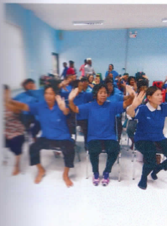
การตั้งวง