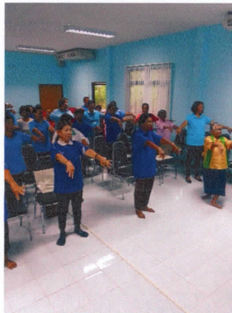
การจับมือ