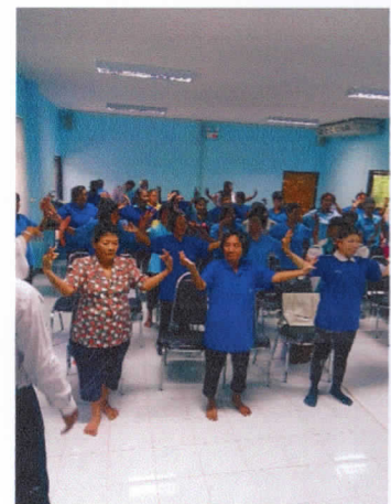
การจับและตั้งวง