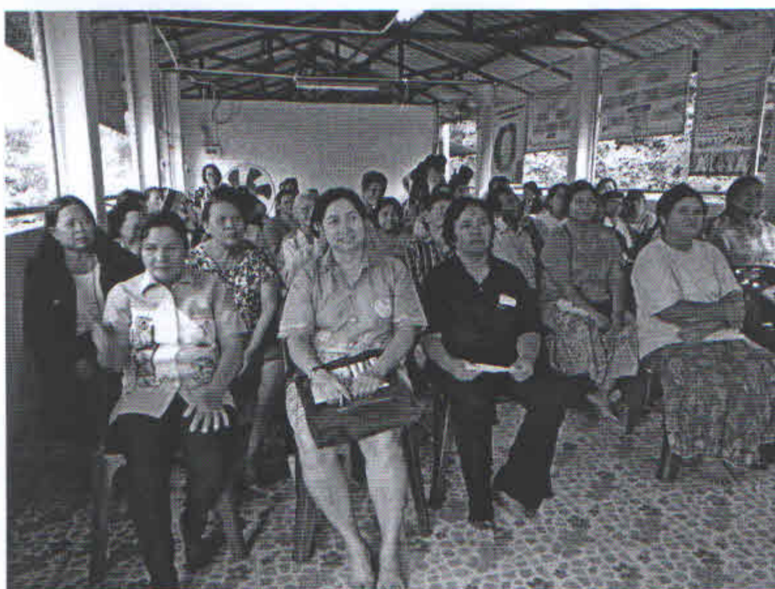
วิทยาการให้ความรู้เรื่องโรคไม่ติดต่อเรื้อรัง