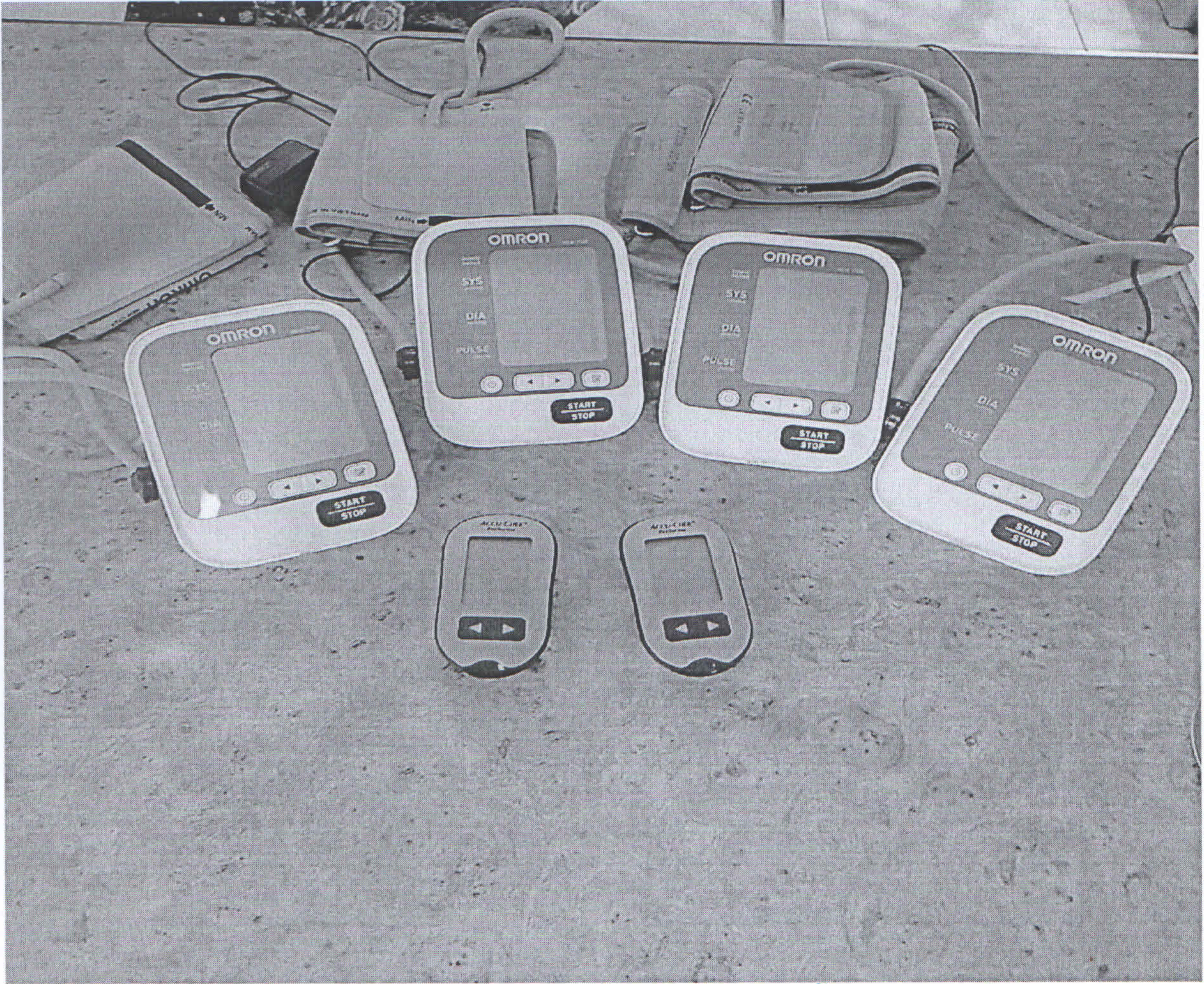
จัดซื้อเครื่องวัดความดัน 4 เครื่อง เครื่องเจาะน้ำตาล 2 เครื่อง