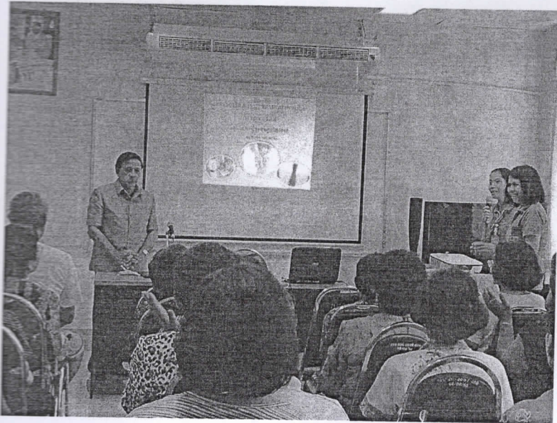
รองนายกเทศมนตรีพัทลุงเปิดโครงการ