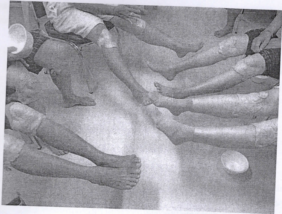
พอกเข้าด้วยสมุนไพร