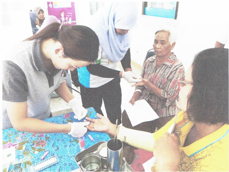
เจาะเลือดเพื่อตรวจหาสารเคมีตกค้างในเลือด