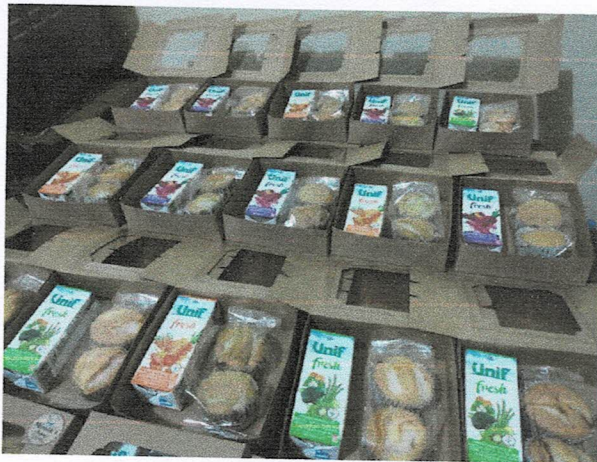
อาหารว่างช่วงเช้า