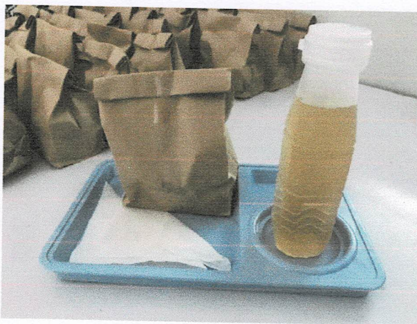
อาหารว่างช่วงบ่าย