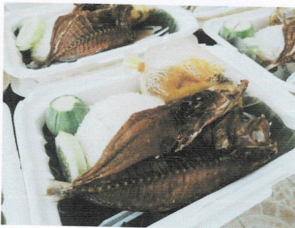
อาหารกลางวัน