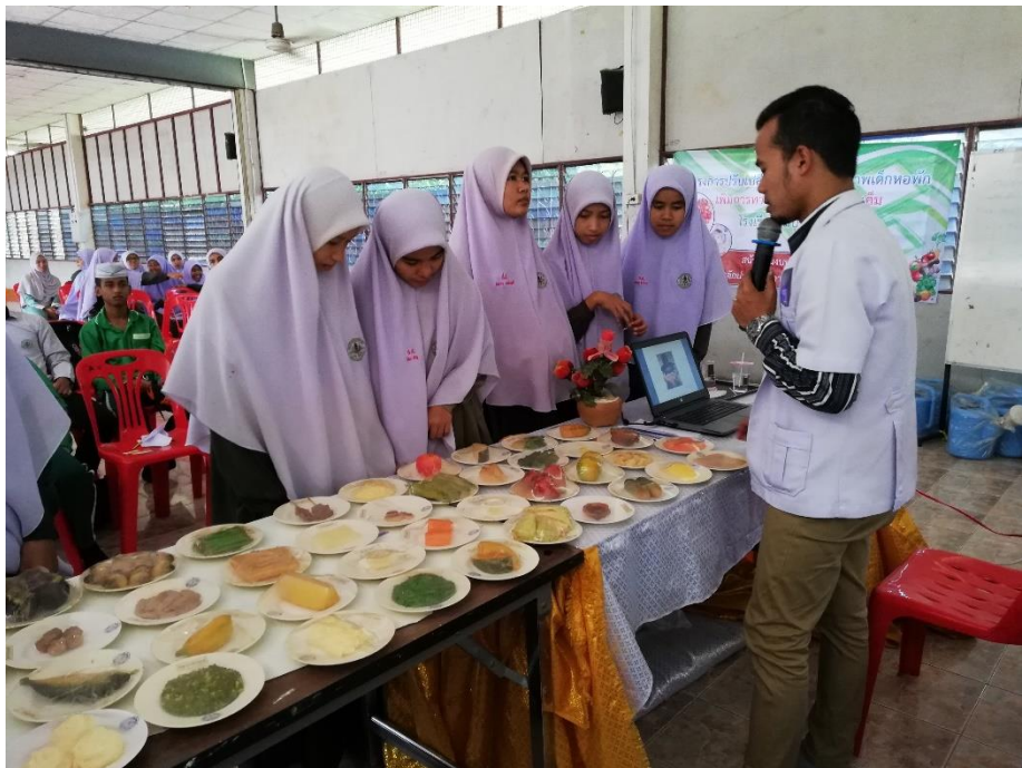
นักเรียนหอพักเรียนรู้การเลือกบริโภคอาหารที่ปลอดภัย ลดหวาน มัน เค็ม