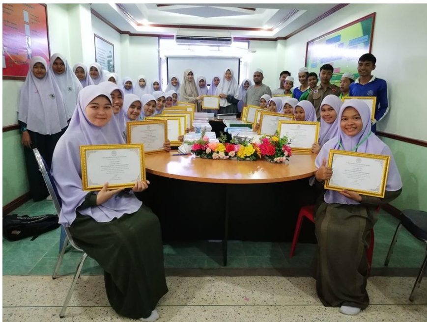
มอบเกียรติบัตรให้กับนักเรียนหอพักที่ได้รับรางวัลจากการประกวด