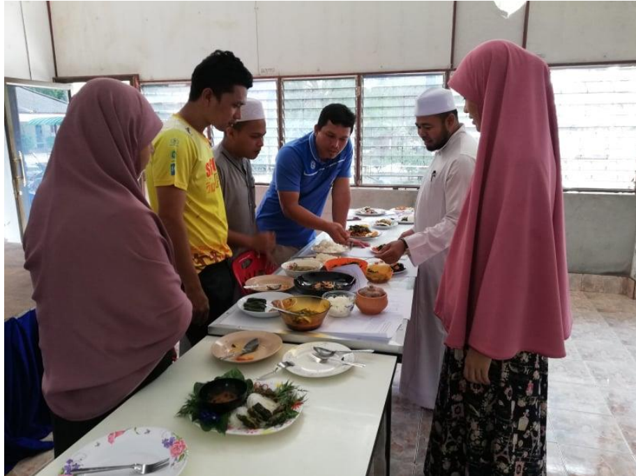
คณะกรรมการตัดสินผลงานการประกวดเมนูอาหารจานผัก