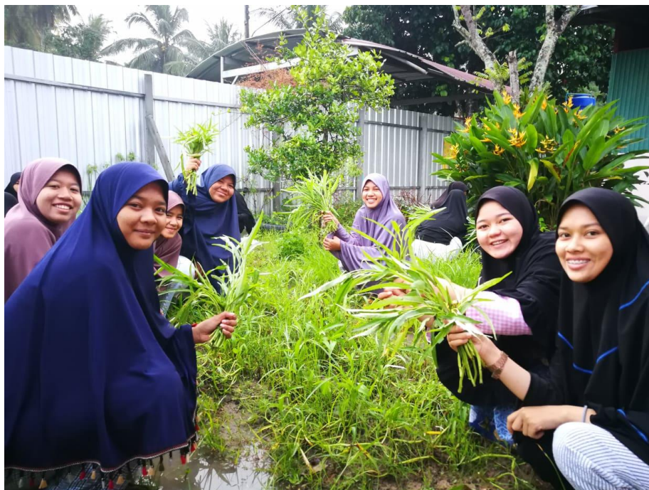
นักเรียนหอพักหญิงเก็บผักเพื่อใช้ประกอบอาหาร