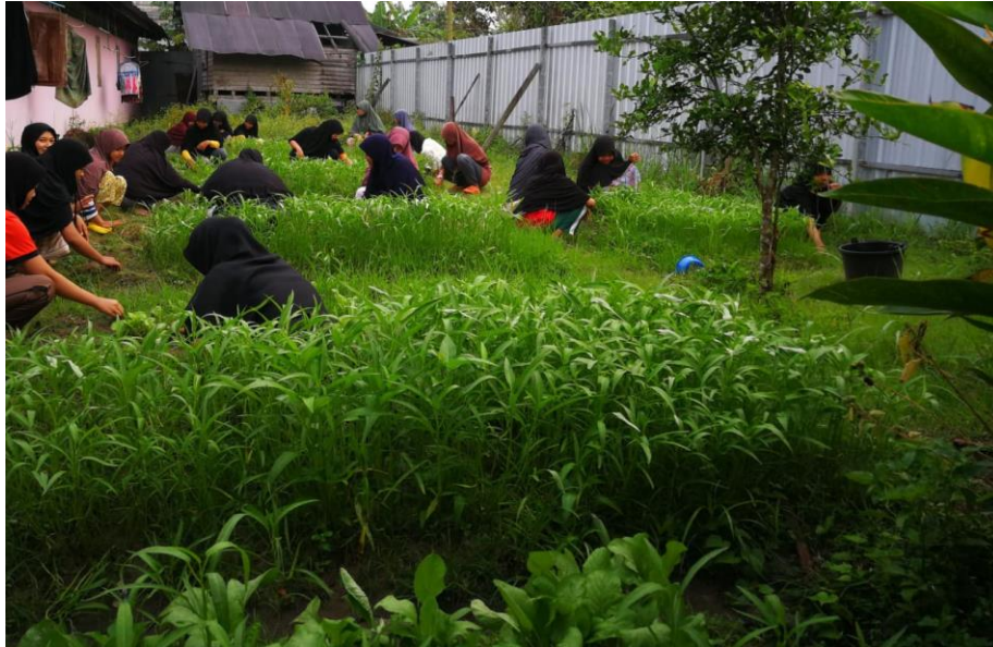
นักเรียนหอพักร่วมกันปลูกและดูแลแปลงผัก