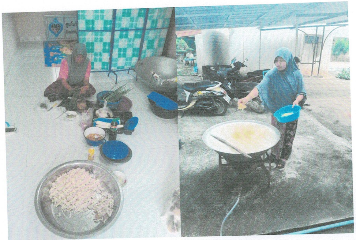
อาหารเช้าหลังจากเจาะเลือดเสร็จ และอาหารว่าง