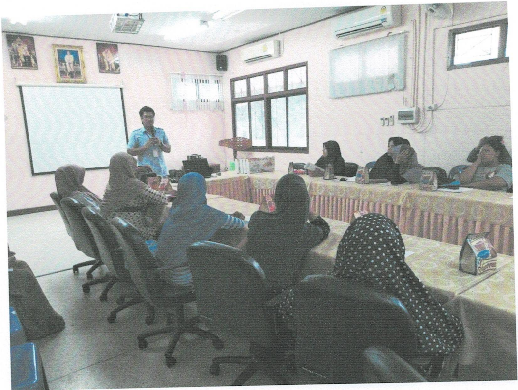
การสอนการออกกำลังกายที่เหมาะสมกับโรค