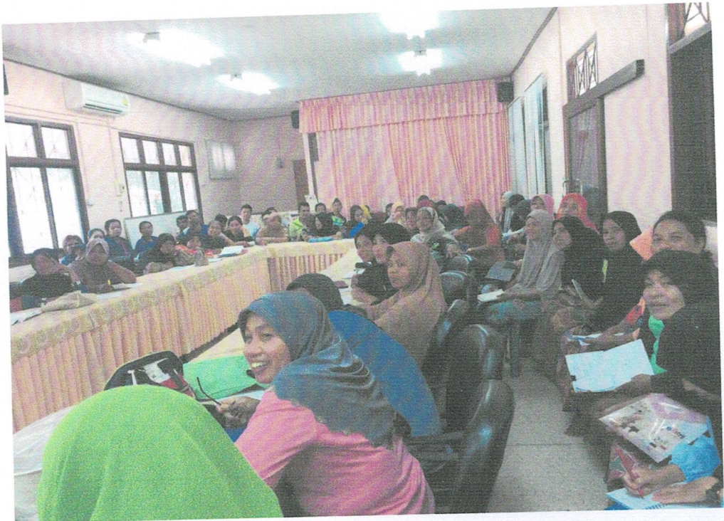
การให้ความรู้ เรื่องโรค พยาธิสภาพ การป้องกัน ภาวะแทรกซ้อน