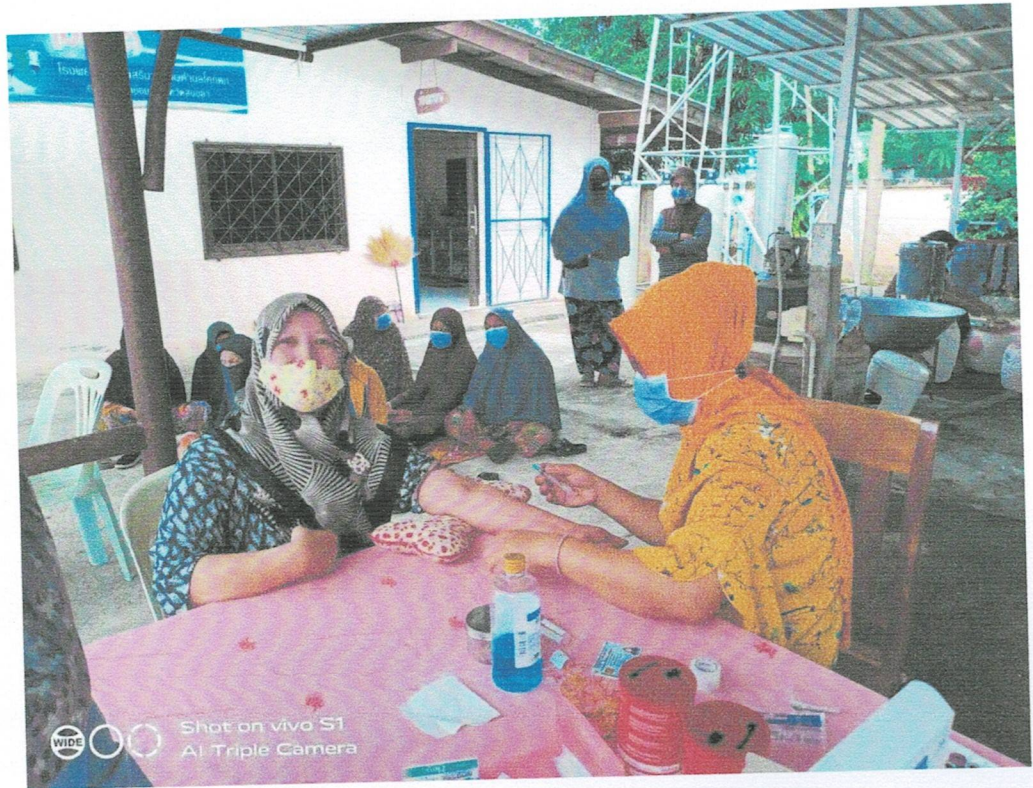
การเจาะเลือดประจำปี เพื่อตรวจหาภาวะแทรกซ้อนทางไต