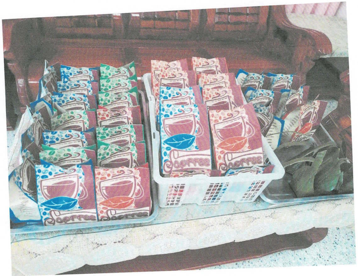
อาหารว่าง