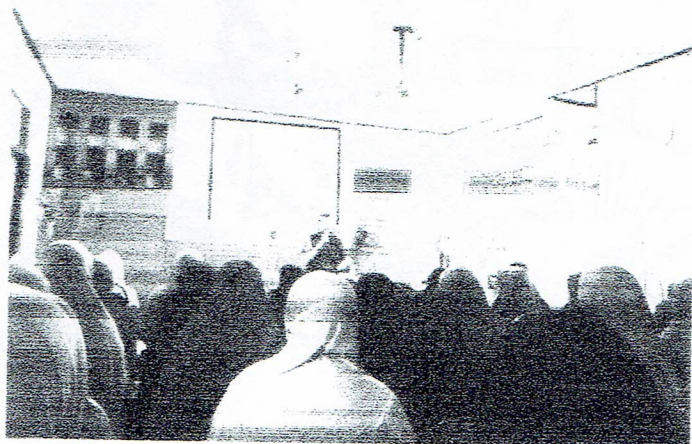
ภาพประกอบกิจกรรมที่ 1:อบรมให้ความรู้และแลกเปลี่ยนเรียนรู้