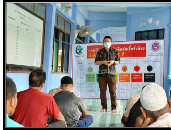
กิจกรรมติดตามกลุ่มเป้าหมาย “โครงการสุขภาพดีวิถีชุมชน ร่วมปรับเปลี่ยนพฤติกรรมสุขภาพ ลดเสี่ยง ลดโรค และลดกลุ่มเสี่ยงและกลุ่มผู้ป่วยโรคความดันโลหิตสูงและโรคเบาหวาน ประจำปี 2563” วันที่ 15 ตุลาคม 2563 เวลา 14.00 น. ณ มัสยิดบ้านลูโป๊ะดาลัย หมู่ที่ 2 ตำบลแว้ง อำเภอแว้ง จังหวัดนราธิวาส