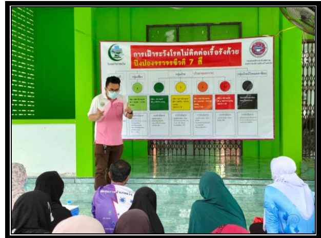
กิจกรรมติดตามกลุ่มเป้าหมาย “โครงการสุขภาพดีวิถีชุมชน ร่วมปรับเปลี่ยนพฤติกรรมสุขภาพ ลดเสี่ยง ลดโรค และลดกลุ่มเสี่ยงและกลุ่มผู้ป่วยโรคความดันโลหิตสูงและโรคเบาหวาน ประจำปี 2563” วันที่ 16 ตุลาคม 2563 เวลา 09.00 น. ณ มัสยิดบ้านขอเลาะทวอ หมู่ที่ 7 ตำบลแว้ง อำเภอแว้ง จังหวัดนราธิวาส