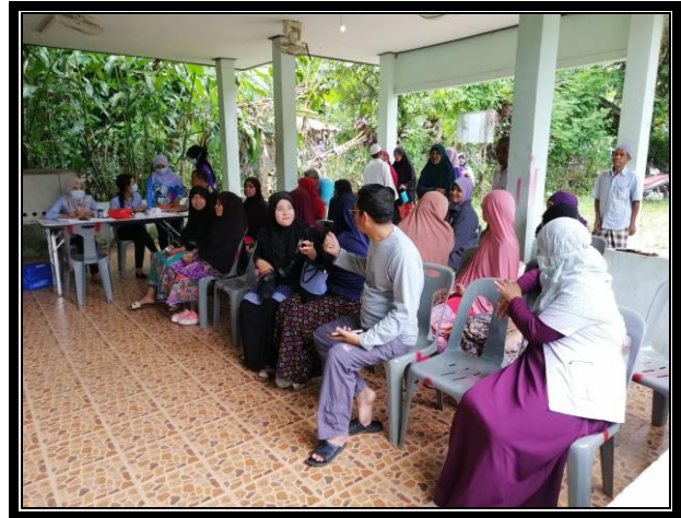
กิจกรรมติดตามกลุ่มเป้าหมาย “โครงการสุขภาพดีวิถีชุมชน ร่วมปรับเปลี่ยนพฤติกรรมสุขภาพ ลดเสี่ยง ลดโรค และลดกลุ่มเสี่ยงและกลุ่มผู้ป่วยโรคความดันโลหิตสูงและโรคเบาหวาน ประจำปี 2563” วันที่ 16 ตุลาคม 2563 เวลา 14.00 น. ณ ศาลาอเนกประสงค์บ้านกัว หมู่ที่ 5 ตำบลแว้ง อำเภอแว้ง จังหวัดนราธิวาส