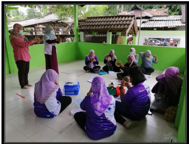
กิจกรรมติดตามกลุ่มเป้าหมาย “โครงการสุขภาพดีวิถีชุมชน ร่วมปรับเปลี่ยนพฤติกรรมสุขภาพ ลดเสี่ยง ลดโรค และลดกลุ่มเสี่ยงและกลุ่มผู้ป่วยโรคความดันโลหิตสูงและโรคเบาหวาน ประจำปี 2563” วันที่ 19 ตุลาคม 2563 เวลา 09.00 น. ณ ศาลามัสยิดบ้านบาลูกา หมู่ที่ 6 ตำบลแว้ง อำเภอแว้ง จังหวัดนราธิวาส