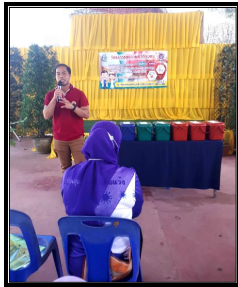
กิจกรรมการกล่าวเปิดโครงการฯ โดยผู้อำนวยการกองสวัสดิการสังคม องค์การบริหารส่วนตำบลเว้ง และได้พบปะ ผู้เข้าร่วม “โครงการสุขภาพดีวิถีชุมชน ร่วมปรับเปลี่ยนพฤติกรรมสุขภาพ ลดเสียง ลดโรค และลด กลุ่มเสี่ยงและกลุ่มผู้ป่วยโรคความดันโลหิตสูงและโรคเบาหวาน ประจำปี 2563” วันที่ 24 กันยายน 2563 ณ ห้องประชุมองค์การบริหารส่วนตำบลเว้ง