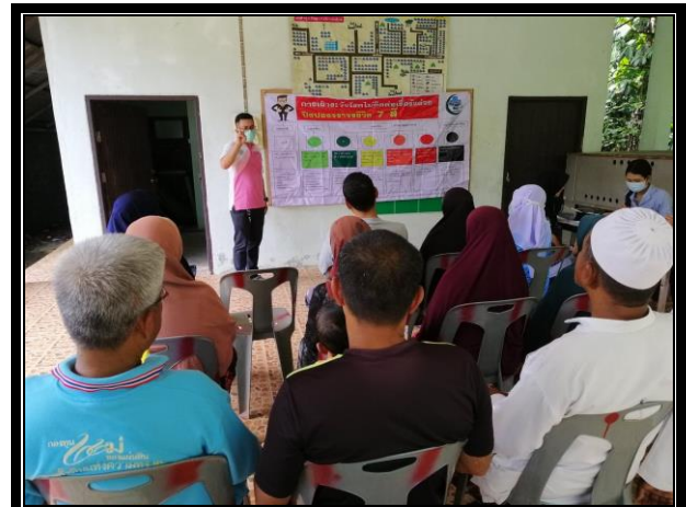
กิจกรรมติดตามกลุ่มเป้าหมาย “โครงการสุขภาพดีวิถีชุมชน ร่วมปรับเปลี่ยนพฤติกรรมสุขภาพ ลดเสี่ยง ลดโรค และลดกลุ่มเสี่ยงและกลุ่มผู้ป่วยโรคความดันโลหิตสูงและโรคเบาหวาน ประจำปี 2563” วันที่ 16 ตุลาคม 2563 เวลา 14.00 น. ณ ศาลาอเนกประสงค์บ้านกัวา หมู่ที่ 5 ตำบลแว้ง อำเภอแว้ง จังหวัดนราธิวาส