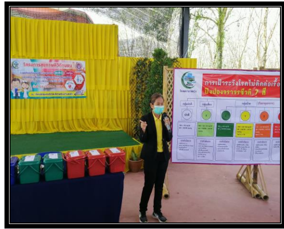
กิจกรรมการบรรยายให้ความรู้สถานการณ์โรคความดันโลหิตสูง และโรคเบาหวาน หรือโรคไม่ติดต่อเรื้อรัง (NCDs)