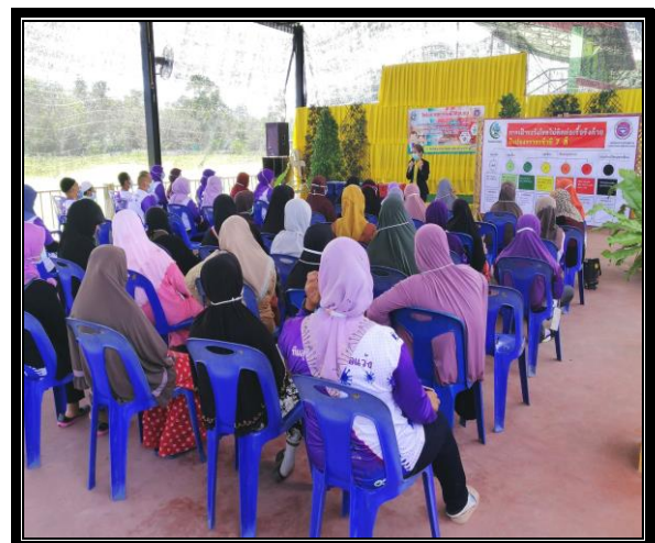
กิจกรรมการบรรยายให้ความรู้สถานการณ์โรคความดันโลหิตสูง และโรคเบาหวาน หรือโรคไม่ติดต่อเรื้อรัง (NCDs)