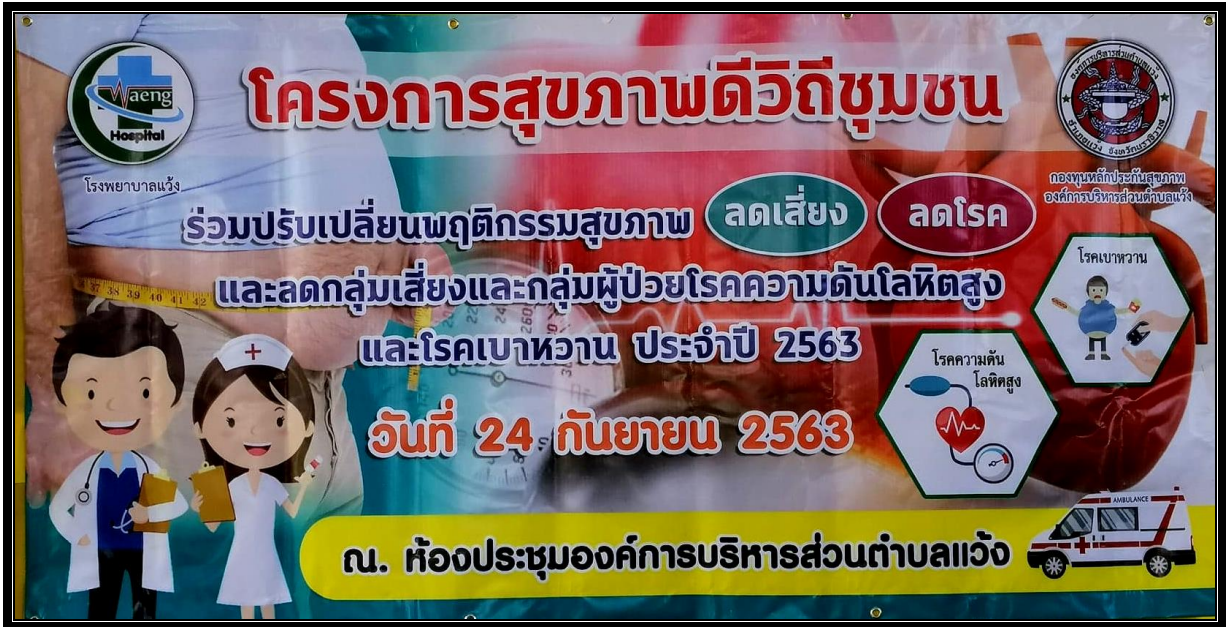
ป้ายไวนิล “โครงการสุขภาพดีวิถีชุมชน ร่วมปรับเปลี่ยนพฤติกรรมสุขภาพ ลดเสี่ยง ลดโรค และลดกลุ่มเสี่ยงและกลุ่มผู้ป่วยโรคความดันโลหิตสูงและโรคเบาหวาน ประจำปี 2563”

กิจกรรม “โครงการสุขภาพดีวิถีชุมชน ร่วมปรับเปลี่ยนพฤติกรรมสุขภาพ ลดเสี่ยง ลดโรค และลดกลุ่มเสี่ยงและกลุ่มผู้ป่วยโรคความดันโลหิตสูงและโรคเบาหวาน ประจำปี 2563”