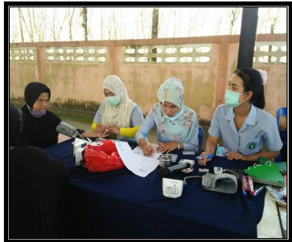
กิจกรรมการแบ่งกลุ่มสี โดยใช้หลักปิงปองจราจรชีวิต 7 สี เพื่อเฝ้าระวังโรคไม่ติดต่อเรื้อรัง (NCDs)