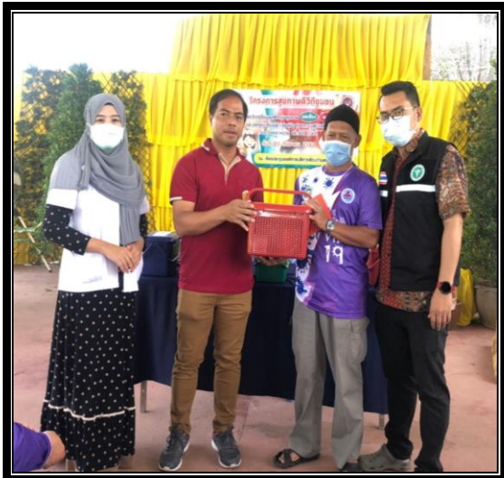
กิจกรรมการมอบเครื่องตรวจวัดระดับน้ำตาลในเลือดพร้อมกับอุปกรณ์การเจาะเลือดที่ปลายนิ้ว ให้กับ ม.1 และ ม.2 ตำบลเว้ง อำเภอเว้ง จังหวัดนครราชสีมา โดยผู้อำนวยการกองสวัสดิการสังคม องค์การบริหารส่วนตำบลเว้ง ใน “โครงการสุขภาพดีวิถีชุมชน ร่วมปรับเปลี่ยนพฤติกรรมสุขภาพ ลดเสียง ลดโรค และลดกลุ่มเสี่ยงและ กลุ่มผู้ป่วยโรคความดันโลหิตสูงและโรคเบาหวาน ประจำปี 2563” วันที่ 24 กันยายน 2563 ณ ห้องประชุมองค์การบริหารส่วนตำบลเว้ง