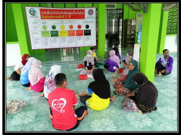
กิจกรรมติดตามกลุ่มเป้าหมาย “โครงการสุขภาพดีวิถีชุมชน ร่วมปรับเปลี่ยนพฤติกรรมสุขภาพ ลดเสี่ยง ลดโรค และลดกลุ่มเสี่ยงและกลุ่มผู้ป่วยโรคความดันโลหิตสูงและโรคเบาหวาน ประจำปี 2563” วันที่ 16 ตุลาคม 2563 เวลา 09.00 น. ณ มัสยิดบ้านขอเลาะทวอ หมู่ที่ 7 ตำบลแว้ง อำเภอแว้ง จังหวัดนราธิวาส