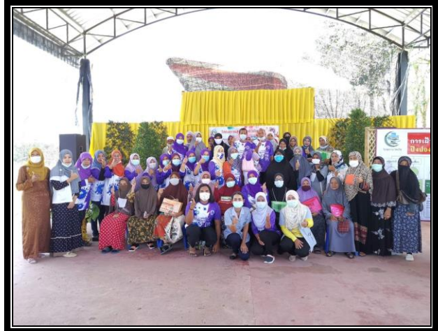
กิจกรรมการจัด “โครงการสุขภาพดีวิถีชุมชน ร่วมปรับเปลี่ยนพฤติกรรมสุขภาพ ลดเสี่ยง ลดโรค และลดกลุ่มเสี่ยง และกลุ่มผู้ป่วยโรคความดันโลหิตสูงและโรคเบาหวาน ประจำปี 2563” วันที่ 24 กันยายน 2563 ณ ห้องประชุมองค์การบริหารส่วนตำบลแว้ง