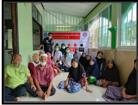
กิจกรรมติดตามกลุ่มเป้าหมาย “โครงการสุขภาพดีวิถีชุมชน ร่วมปรับเปลี่ยนพฤติกรรมสุขภาพ ลดเสี่ยง ลดโรค และลดกลุ่มเสี่ยงและกลุ่มผู้ป่วยโรคความดันโลหิตสูงและโรคเบาหวาน ประจำปี 2563” วันที่ 15 ตุลาคม 2563 เวลา 09.00 น. ณ มัสยิดละหาร หมู่ที่ 1 ตำบลแว้ง อำเภอแว้ง จังหวัดนราธิวาส