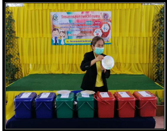
กิจกรรมการบรรยายให้ความรู้เรื่อง อ.อาหาร สำหรับกลุ่มเสี่ยง / ผู้ป่วยโรคความดันโลหิตสูง และโรคเบาหวาน หรือโรคไม่ติดต่อเรื้อรัง (NCDs) อื่นๆ