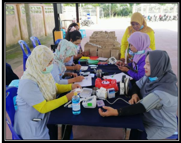
กิจกรรมลงทะเบียนผู้เข้าร่วมโครงการฯ และการคัดกรองโรคความดันโลหิต และโรคเบาหวาน