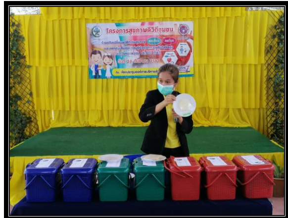
กิจกรรมการบรรยายให้ความรู้เรื่อง อ.อาหาร สำหรับกลุ่มเสี่ยง / ผู้ป่วยโรคความดันโลหิตสูง และโรคเบาหวาน หรือโรคไม่ติดต่อเรื้อรัง (NCDs) อื่นๆ