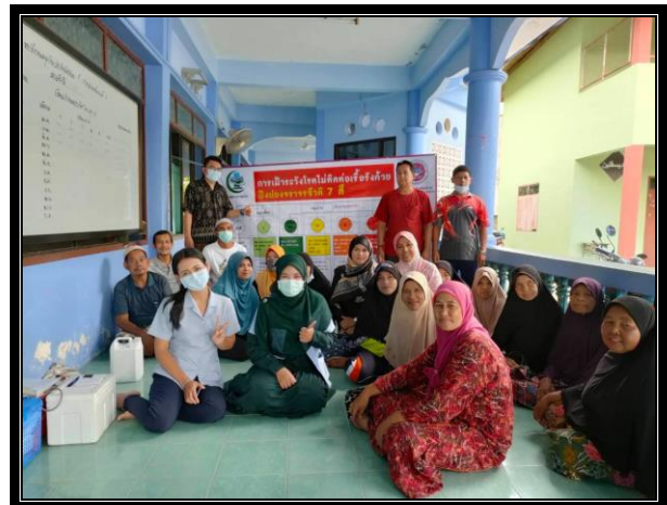
กิจกรรมติดตามกลุ่มเป้าหมาย “โครงการสุขภาพดีวิถีชุมชน ร่วมปรับเปลี่ยนพฤติกรรมสุขภาพ ลดเสี่ยง ลดโรค และลดกลุ่มเสี่ยงและกลุ่มผู้ป่วยโรคความดันโลหิตสูงและโรคเบาหวาน ประจำปี 2563” วันที่ 15 ตุลาคม 2563 เวลา 14.00 น. ณ มัสยิดบ้านลูโป๊ะดาลัย หมู่ที่ 2 ตำบลแว้ง อำเภอแว้ง จังหวัดนราธิวาส