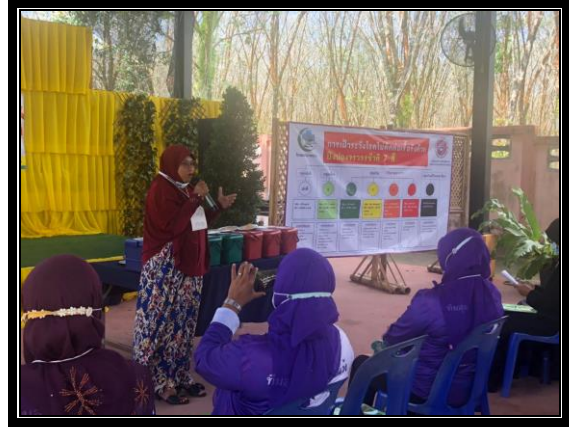
กิจกรรมการจัด “โครงการสุขภาพดีวิถีชุมชน ร่วมปรับเปลี่ยนพฤติกรรมสุขภาพ ลดเสี่ยง ลดโรค และลดกลุ่มเสี่ยง และกลุ่มผู้ป่วยโรคความดันโลหิตสูงและโรคเบาหวาน ประจำปี 2563” วันที่ 24 กันยายน 2563 ณ ห้องประชุมองค์การบริหารส่วนตำบลแว้ง