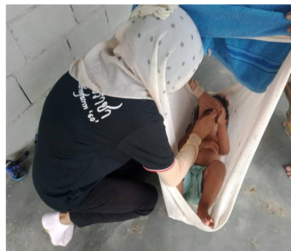
รณรงค์และติดตามเด็ก อายุ 0-5 ปี ที่ได้รับวัคซีนไม่ครบตามเกณฑ์