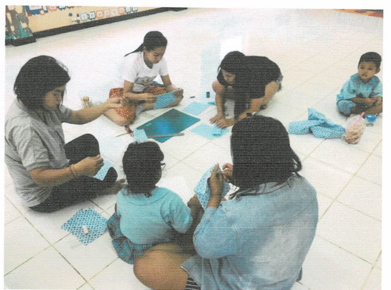
ผู้ปกครองและนักเรียนร่วมกิจกรรมการทำหน้ากาก