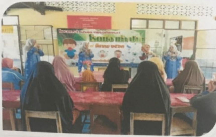
วิทยากร ครูและผู้ปกครองได้ปฏิบัติการล้างมือที่ถูกต้องกับเจลล้างมือ