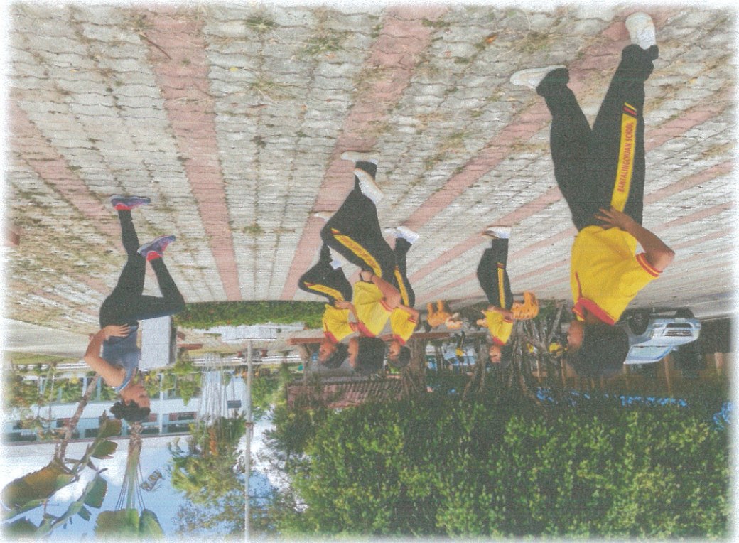
ប្រឡូកការងារអោយមានលទ្ធផលប្រសើរជាងគេ