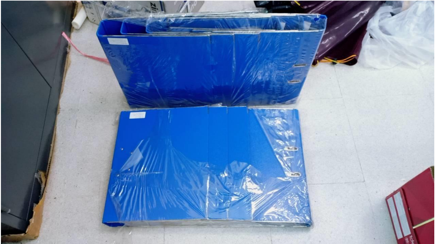
๑. แฟ้มคณะแบบ (๖๕) จำนวน ๒ แฟ้ม