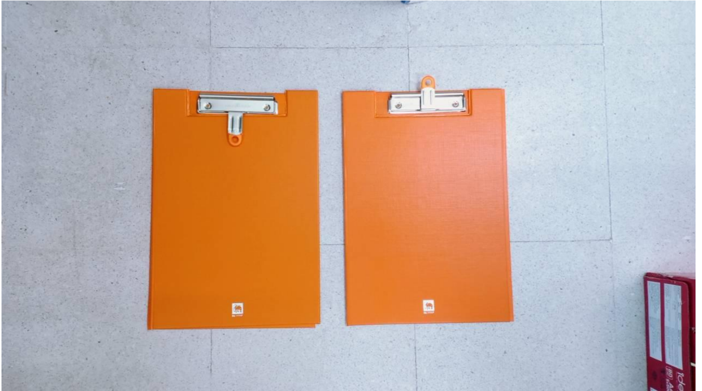
๒. คลิปบอร์ด F๔ トラ้าง ๑๑๑๑F สีส้ม จำนวน ๒ อัน