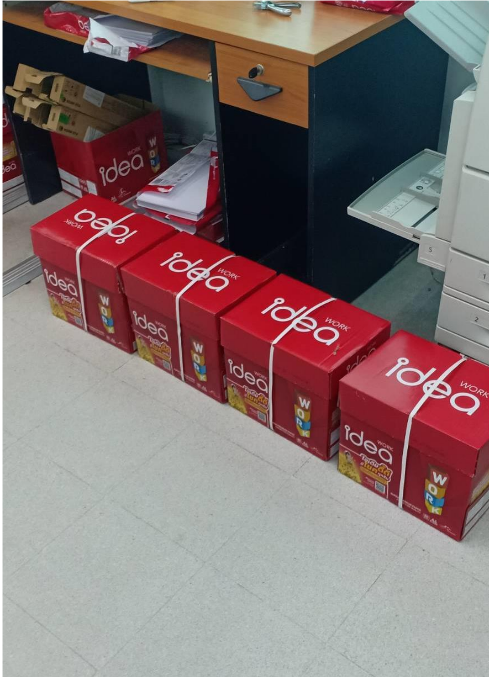
๖. กระดาษถ่ายเอกสาร A๔ idea Work (๕๐๐ แผ่น) จำนวน ๔ ลัง