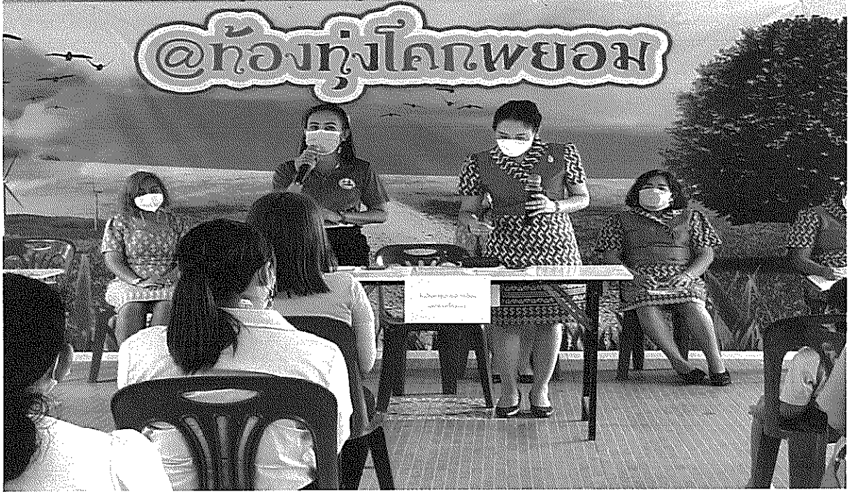
จัดประชุมผู้ปกครองชี้แจงข้อตกลง และการร่วมกันเฝ้าระวังการแพร่ระบาดของเชื้อไวรัสโคโรนา 2019 ภายในสถานศึกษา ก่อนเปิดภาคเรียน โดยเชิญเจ้าหน้าที่สาธารณสุขมาให้ความรู้ความเข้าใจ