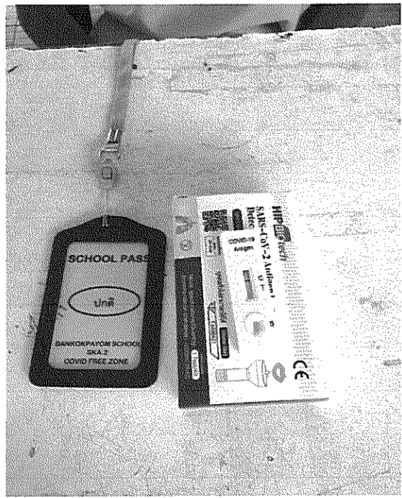
ครูตรวจโควิด-19 โดยวิธีตรวจน้ำลาย ให้แก่นักเรียน เพื่อป้องกันการแพร่ระบาดภายในสถานศึกษา