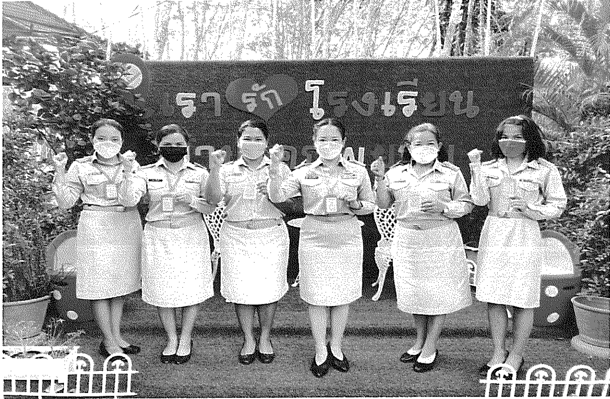
ครูและบุคลากรทางการศึกษาโรงเรียนบ้านโคกพยอมได้รับการตรวจโควิด-19 โดยวิธีตรวจน้ำลาย ทุกคน เพื่อป้องกันการแพร่ระบาดภายในสถานศึกษา