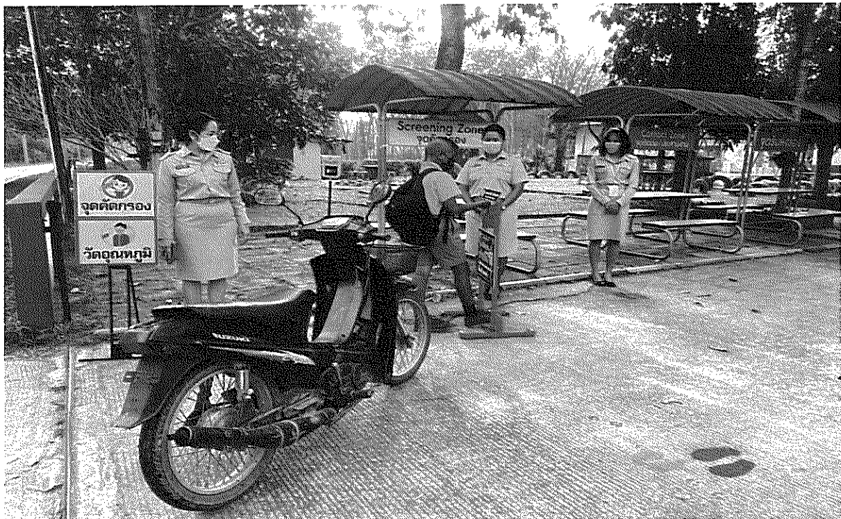
มีการคัดกรองนักเรียนทุกคนก่อนเข้าเรียน โดยการสแกนอุณหภูมิ และล้างมือด้วยเจลแอลกอฮอล์ล้างมือ