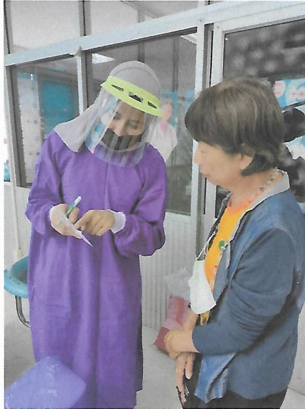
ให้คำแนะนำผู้ที่มีปัญหาสุขภาพช่องปาก