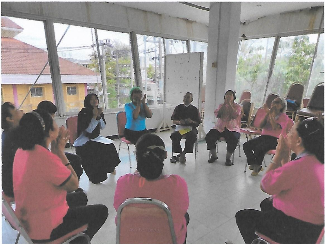
กิจกรรมฐาน โดยทันตบุคลากร : ฐานบริหารกล้ามเนื้อใบหน้า ลิ้น และนวดกระตุ้นต่อมน้ำลาย