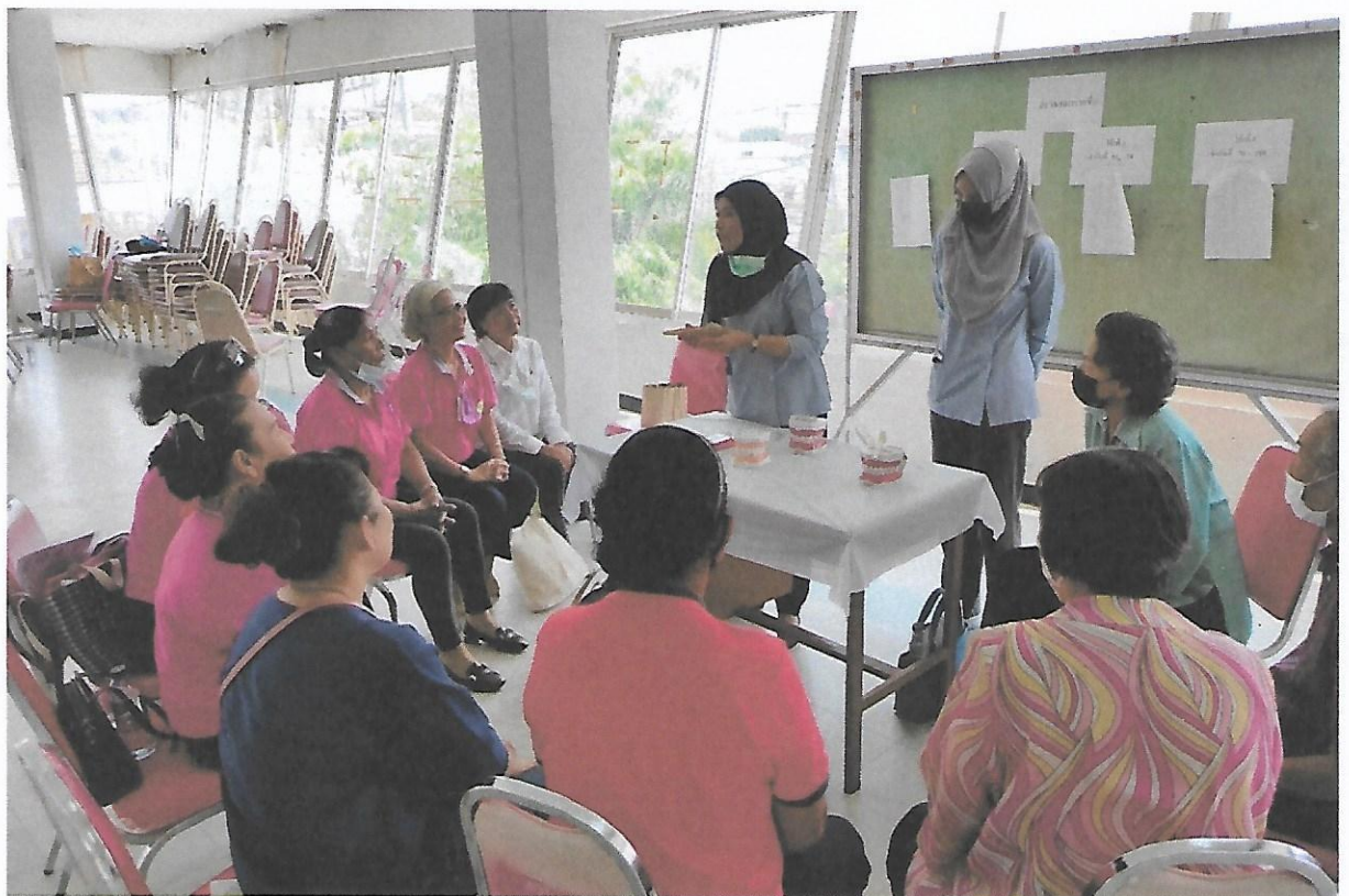
กิจกรรมฐาน โดยทันตบุคลากร : การแปรงฟันที่ถูวิธี