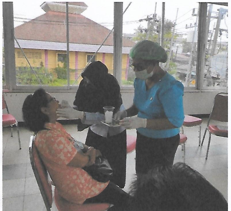
กิจกรรมข้อมสีฟันเพื่อเตรียมฝึกปฏิบัติการแปรงฟัน