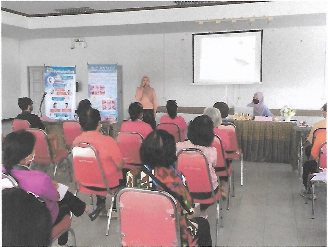
บรรยายความรู้ เรื่องโรคในช่องปากที่พบบ่อยในผู้สูงอายุ และการดูแลสุขภาพของตนเองในสถานการณ์ โควิด-19