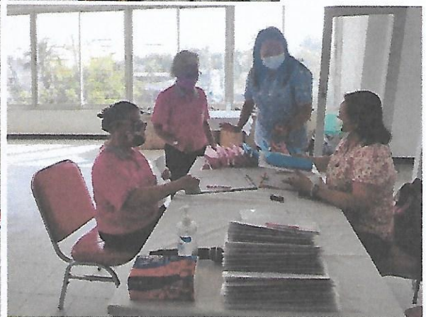
ลงทะเบียน และวัดไข้ผู้ร่วมอบรม