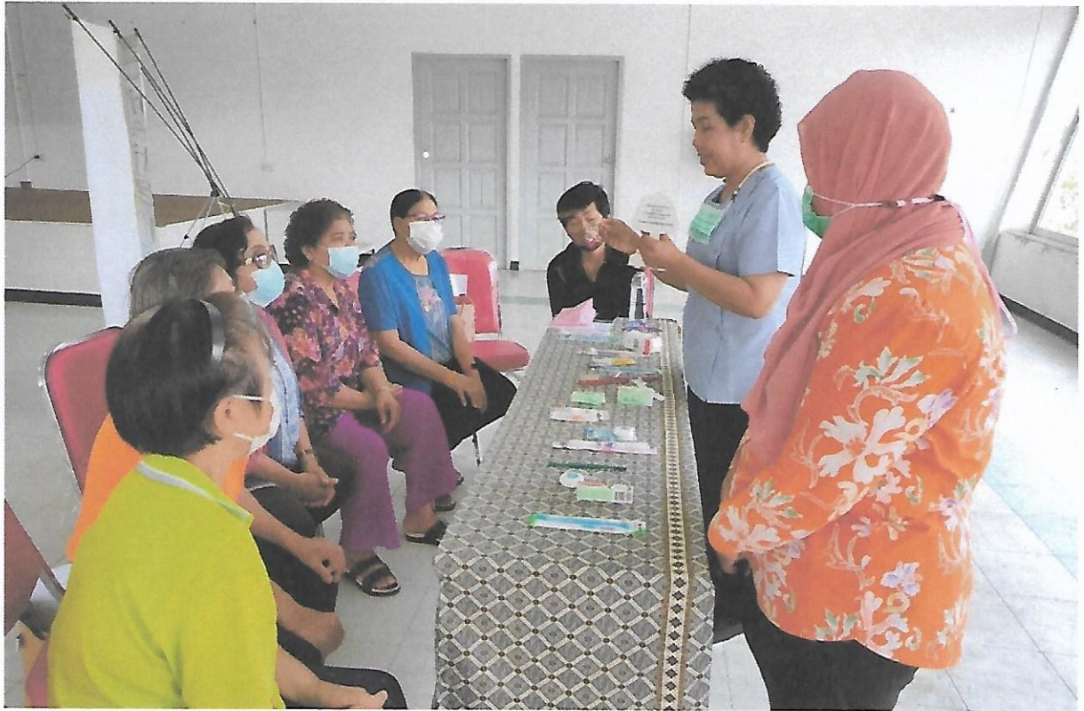
กิจกรรมฐาน โดยทันตบุคลากร : ฐานการใช้อุปกรณ์เสริมในการทำความสะอาดช่องปาก