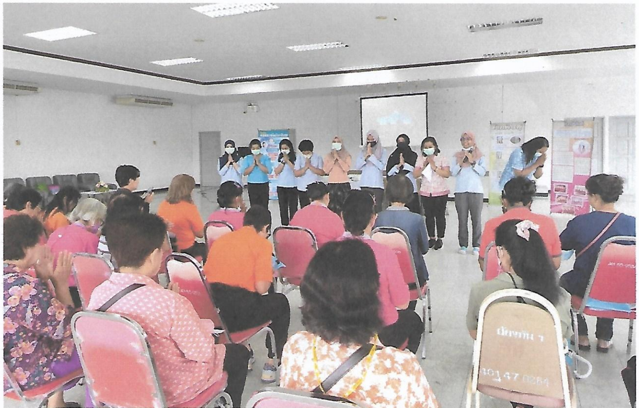
ทีมผู้จัด กล่าวขอบคุณผู้มาเข้าร่วมอบรม