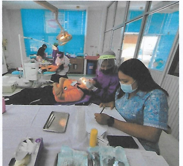
กิจกรรมตรวจสุขภาพช่องปาก และคราบสีติดฟัน เพื่อประเมินการแปรงฟัน