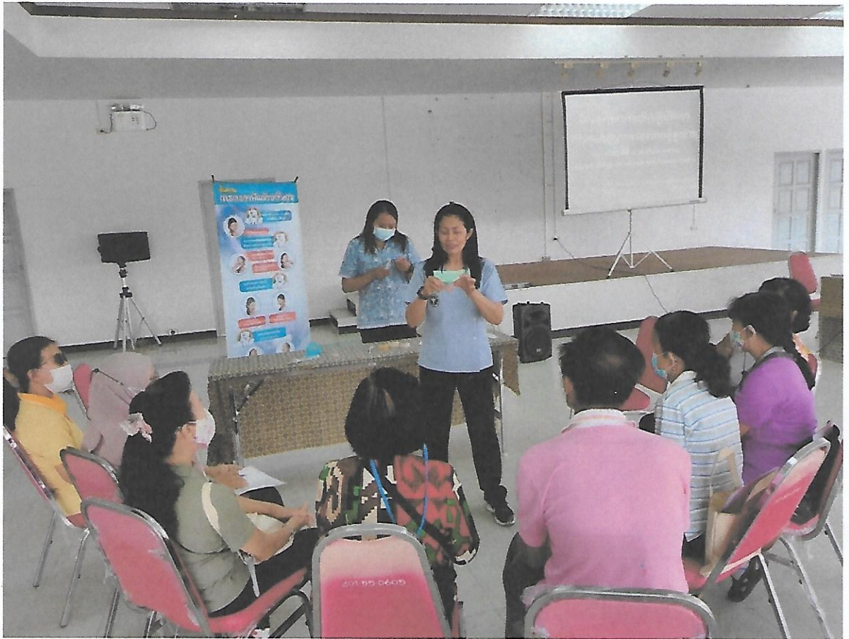
กิจกรรมฐาน โดยทันตบุคลากร : ฟันเทียมชนิดต่างๆ และการทำความสะอาดฟันเทียม