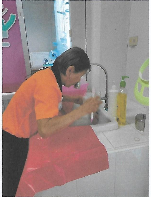
กิจกรรมฝึกปฏิบัติการแปรงฟัน