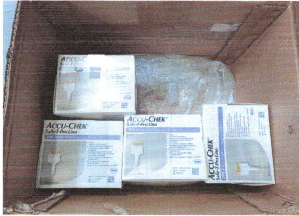
1. เข็มเจาะเลือด Safe-T-pro Uno