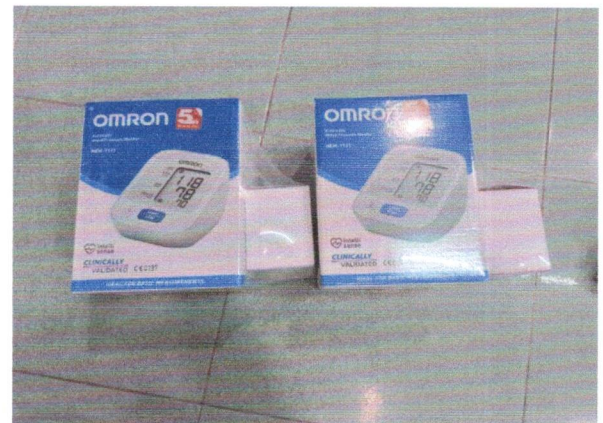
4. เครื่องวัดความดันโลหิต Omron HEM7/121