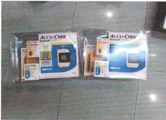
3. เครื่องตรวจน้ำตาลในเลือด Accu-chek instant