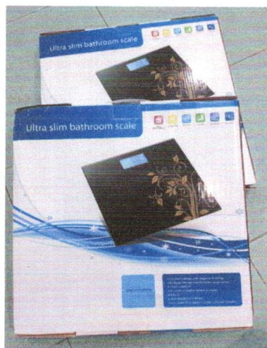
5. เครื่องชั่งน้ำหนักดิจิตอล Beryl รุ่น BY823