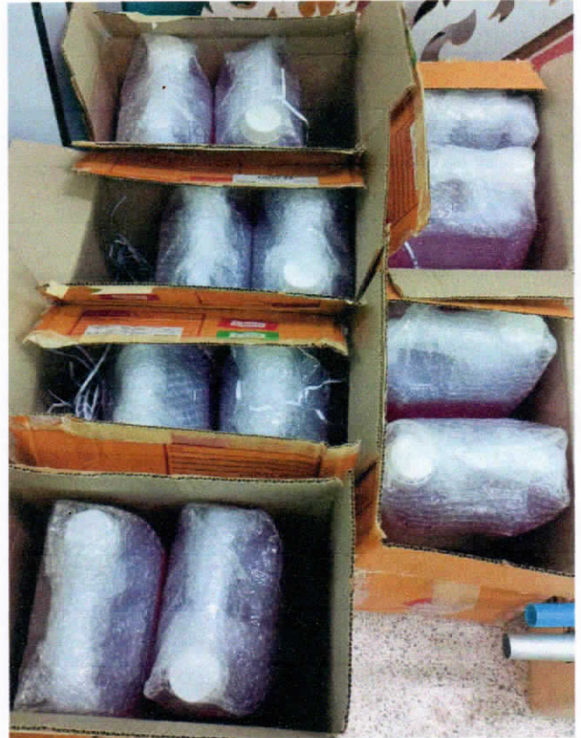
เจลแอลกอฮอล์ล้างมือ ขนาด 1 ลิตร จำนวน 60 ลิตร