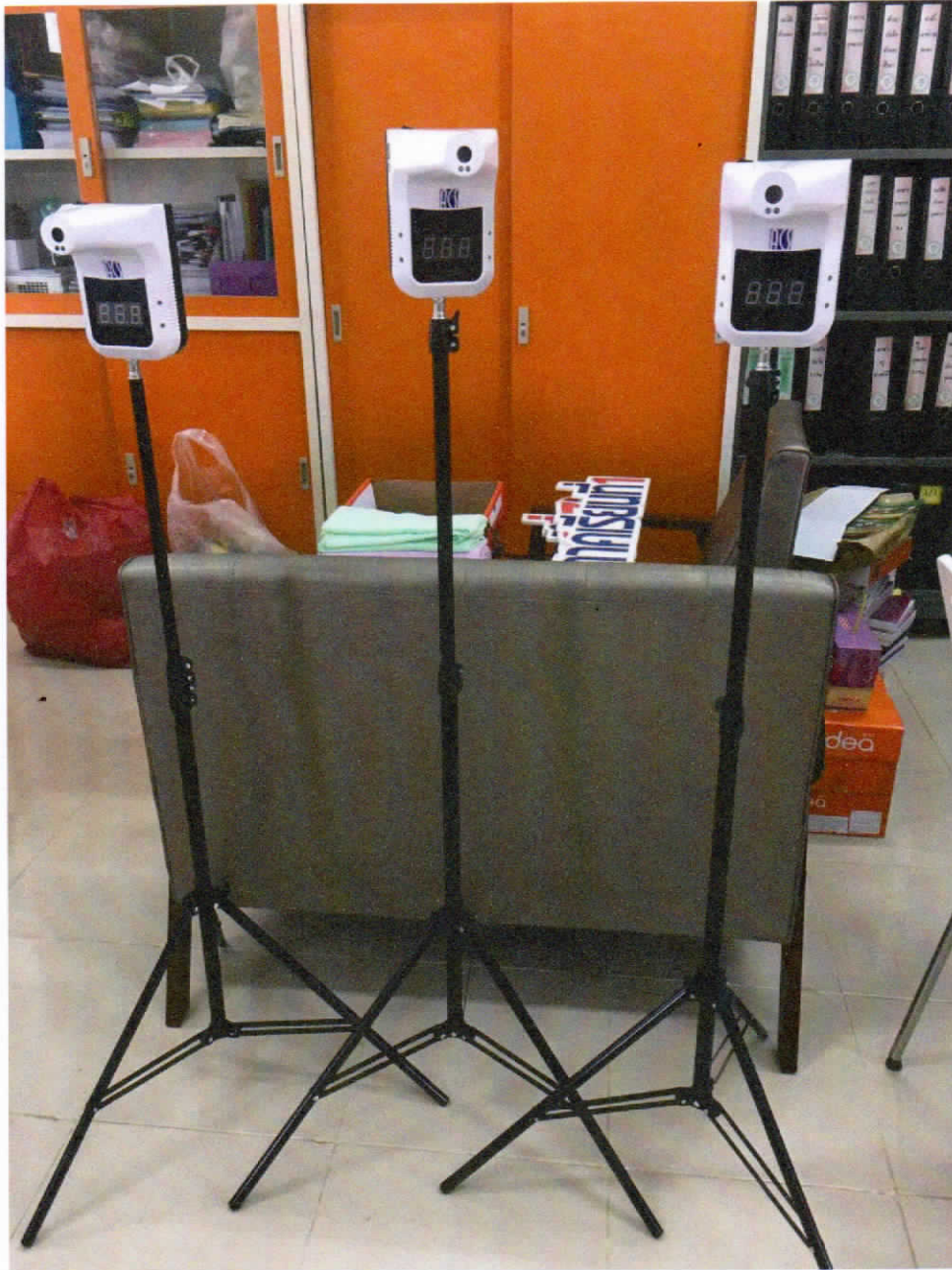
เครื่องวัดอุณหภูมิร่างกายอัตโนมัติ พร้อมขาตั้ง จำนวน 3 เครื่อง