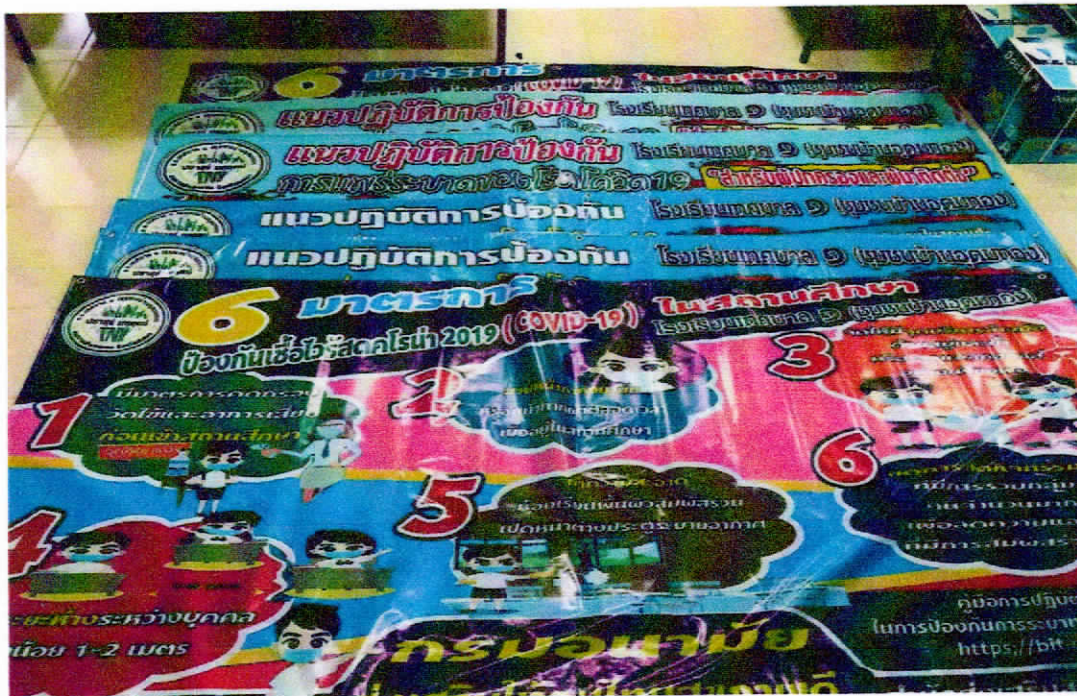
ไวเนล ขนาด 2.5 x 1.5 เมตร จำนวน 6 ผืน