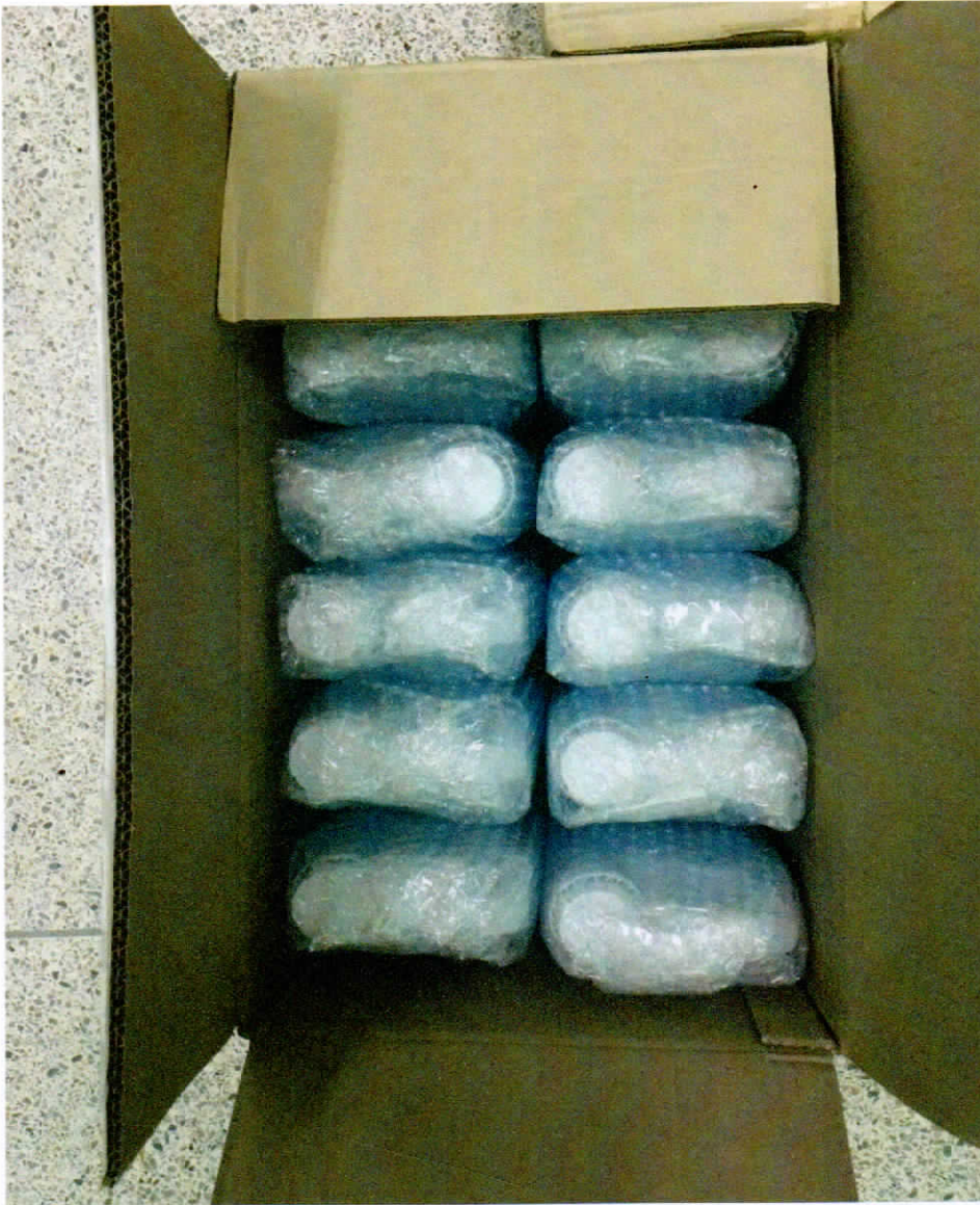
น้ำยาฆ่าเชื้อขนาด 5,000 มิลลิลิตร/ แกลอน จำนวน 12 แกลอน