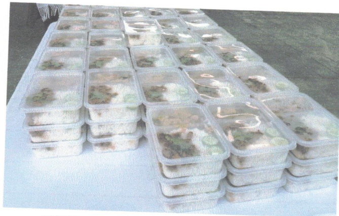
เค้กกล้วยหอม และน้ำดื่ม ข้าวคลุกกะปิ