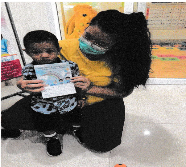
มอบนม และให้คำแนะนำการใช้สมุดประจำตัวแก่ผู้ปกครอง ประเมินซึ่งน้ำหนักส่วนสูงซ้ำหลังสนับสนุนนม