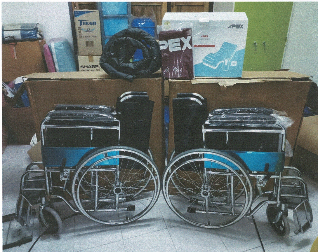
ที่นอนลมแบบขวาง และรถเข็นผู้ป่วยแบบพับได้