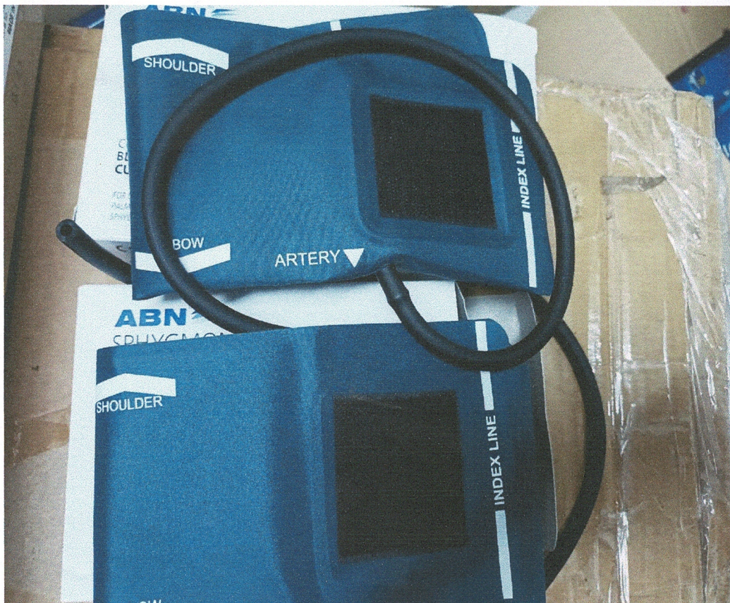
สายวัดความดัน เบอร์ S