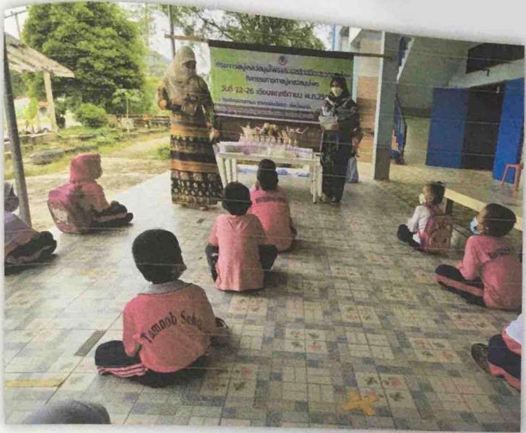
วิทยากรแนะนำวัสดุ อุปกรณ์การทำสบู่เหลวสมุนไพร