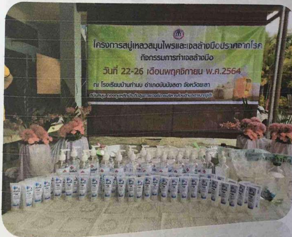
กิจกรรมการทำเจลล้างมือ