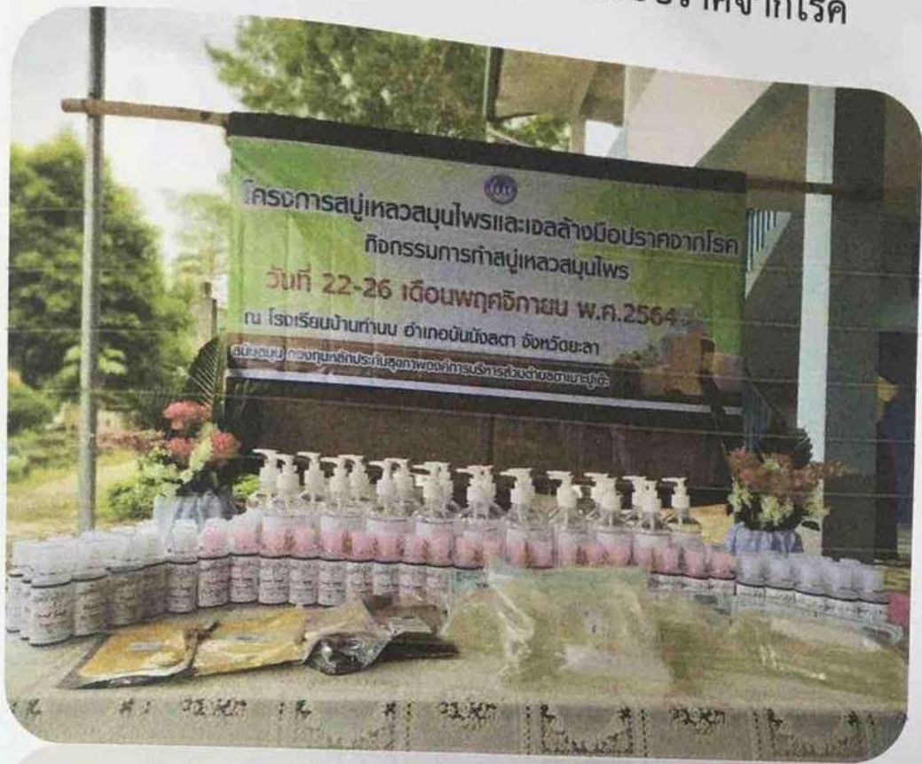
กิจกรรมการทำสบู์เหลวสมุนไพร