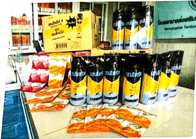
สเปรย์กำจัดยุงและโลชั่นทากันยุง