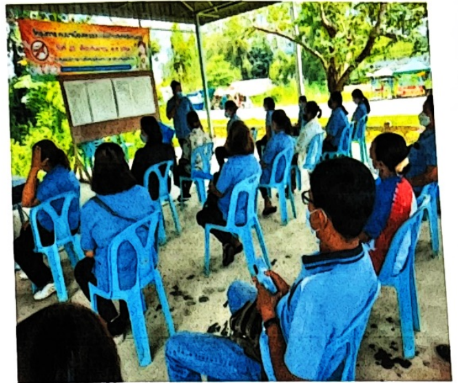
อบรมให้ความรู้เรื่องโรคไข้เลือดออก วิจารณ์ และประเมิน แนวโน้มปัญหาโรคไข้เลือดออกในชุมชน