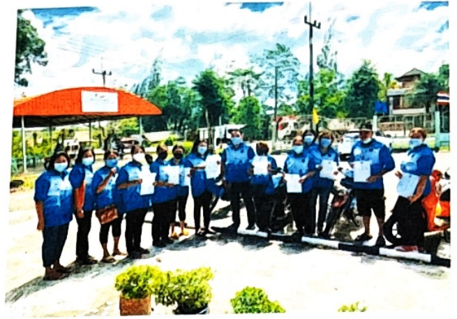
ทีมประเมินลูกน้ำยุงลาย