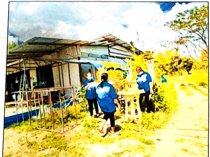
กิจกรรมประเมินความชุกลูกน้ำยุงลายในชุมชน