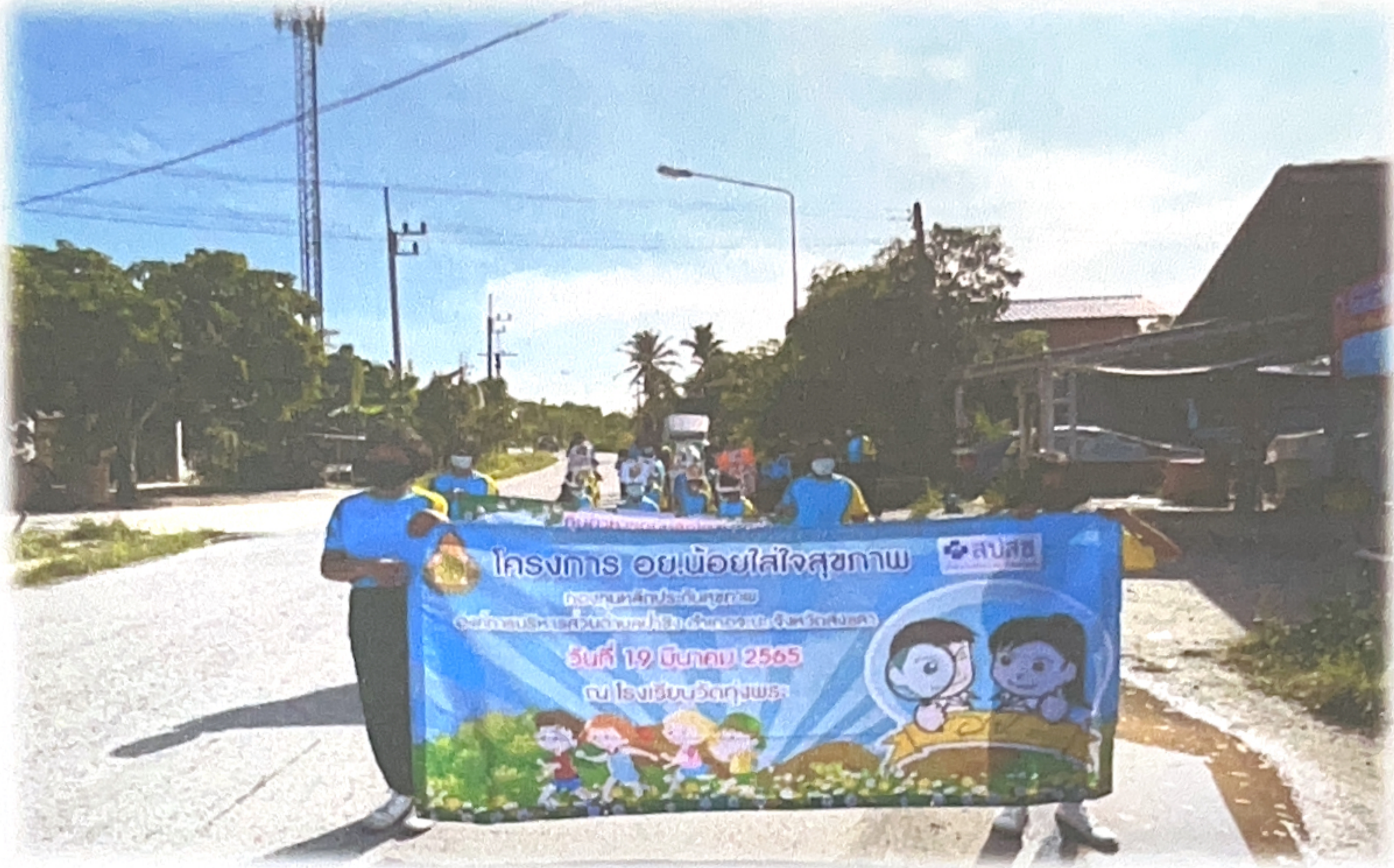
ภาพกิจกรรมเดินรณรงค์โครงการ อย.น้อยใส่ใจสุขภาพ