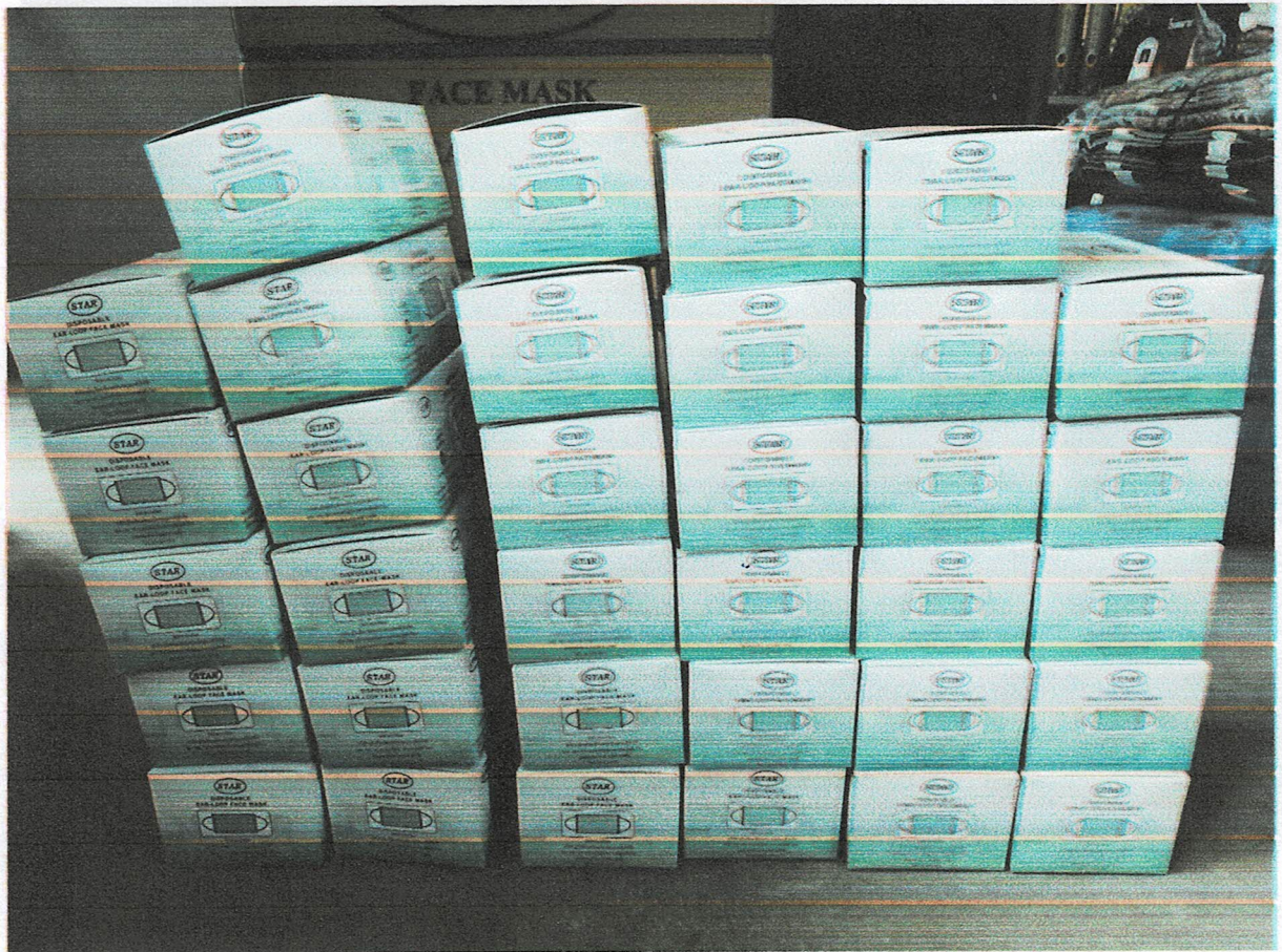
วัสดุ อุปกรณ์ (หน้ากากอนามัย ปรอทวัดไข้ เจลแอลกอฮอล์ ถุงขยะติดเชื้อ)