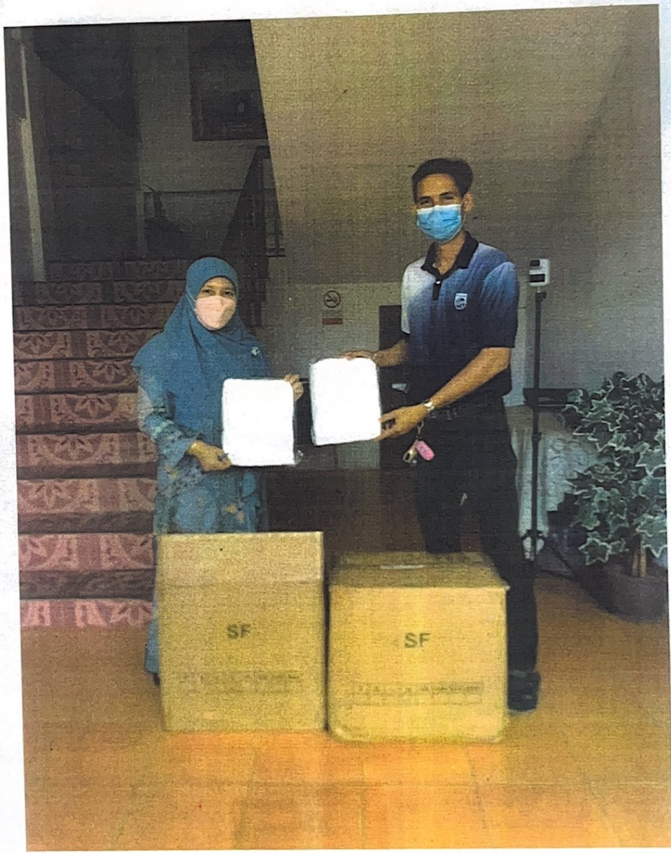
รับมอบ ชุด PPE จากร้านนาชนิน การค้า