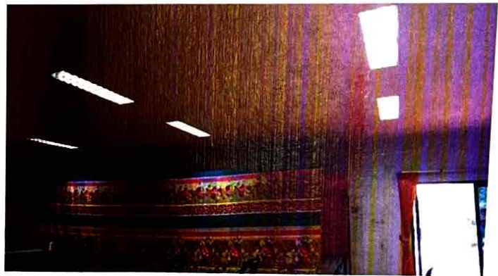
ม่านกันแสงแยกเตียง ขนาดยาว ๖ เมตร