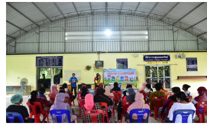
กิจกรรมหมู่บ้านที่ 5