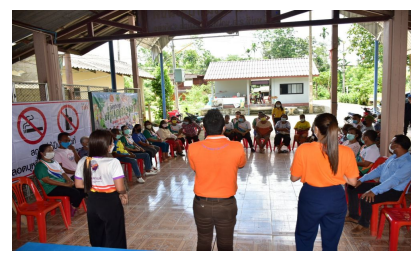
กิจกรรมหมู่บ้านที่ 2