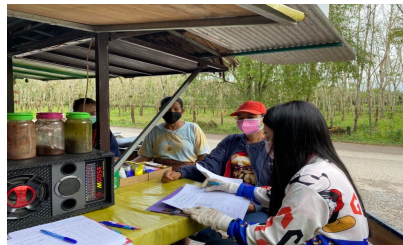
คณะทำงานสำรวจข้อมูลขยะ