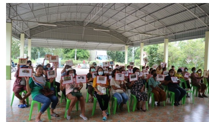
กิจกรรมหมู่บ้านที่ 2