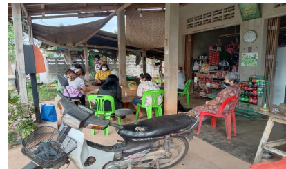
สำรวจข้อมูล