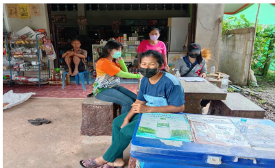
สำรวจข้อมูล