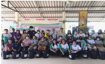
กิจกรรมหมู่ที่ 2