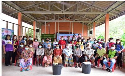
กิจกรรมหมู่บ้านที่ 6