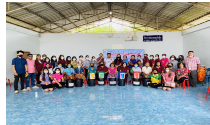
กิจกรรมหมู่บ้านที่ 7