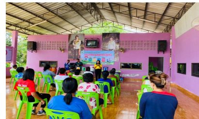
กิจกรรมหมู่บ้านที่ 11