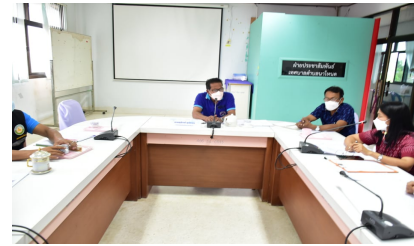
เลขานุการคณะทำงานชี้แจงรายละเอียด