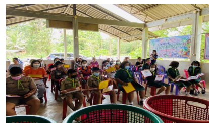
พื้นที่กิจกรรมใหม่ กิจกรรมหมู่บ้านที่ 9