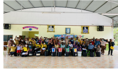
กิจกรรมหมู่ที่ 2