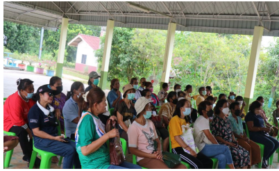
กิจกรรมหมู่บ้านที่ 11