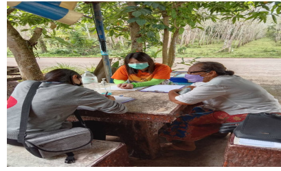
สำรวจข้อมูล