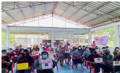
กิจกรรมหมู่บ้านที่ 7