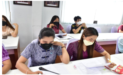
ประชุมคณะทำงาน