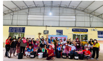
กิจกรรมหมู่บ้านที่ 5