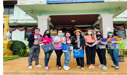
คณะทำงาน