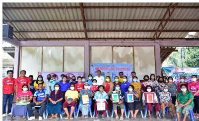
กิจกรรมหมู่บ้านที่ 8