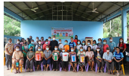
กิจกรรมหมู่บ้านที่ 10