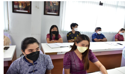
คณะทำงานรับฟังคำชี้แจง