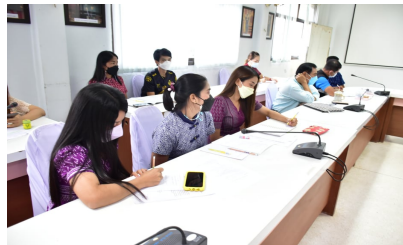
คณะทำงานรับฟังคำชี้แจง