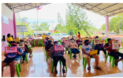
กิจกรรมหมู่บ้านที่ 11