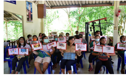
กิจกรรมหมู่บ้านที่ 3