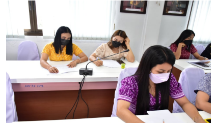
ประชุมคณะทำงาน