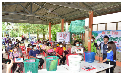
กิจกรรมหมู่บ้านที่ 6