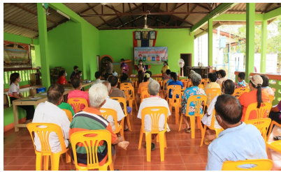
กิจกรรมหมู่บ้านที่ 4