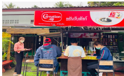
สำรวจข้อมูล