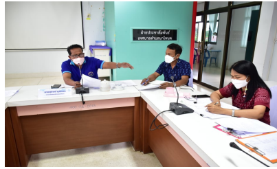
ประธานชี้แจงรายละเอียด