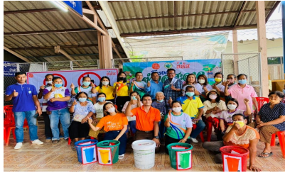
กิจกรรมหมู่บ้านที่ 2

รายงานจากพื้นที่ Project owner , My Report , Editable