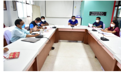
คณะผู้บริหารเข้าร่วมประชุม