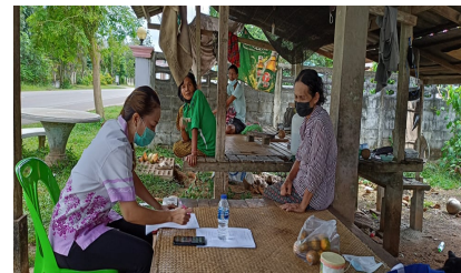
สำรวจข้อมูล