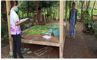
สำรวจข้อมูล