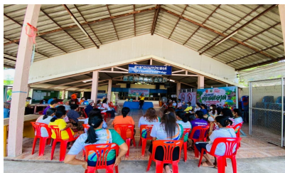
กิจกรรมหมู่บ้านที่ 2