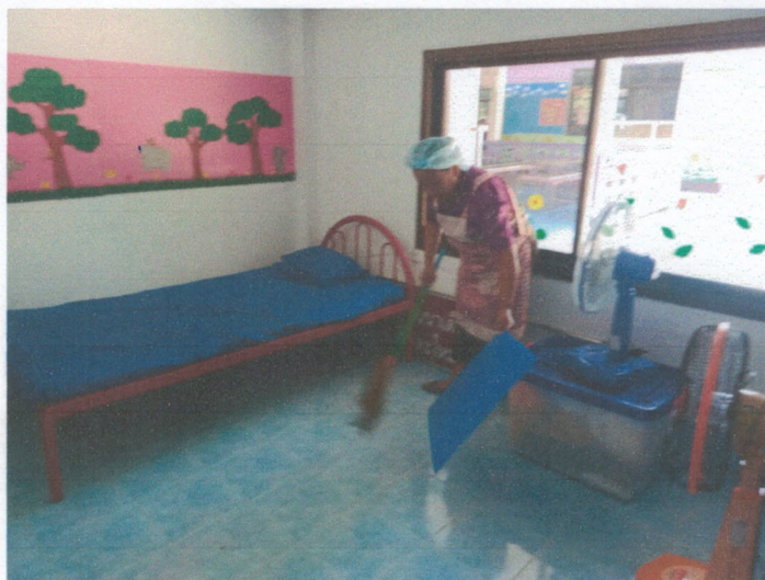
ห้องพยาบาล