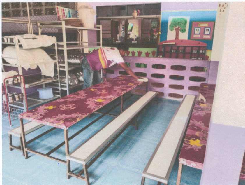
ห้องครัว