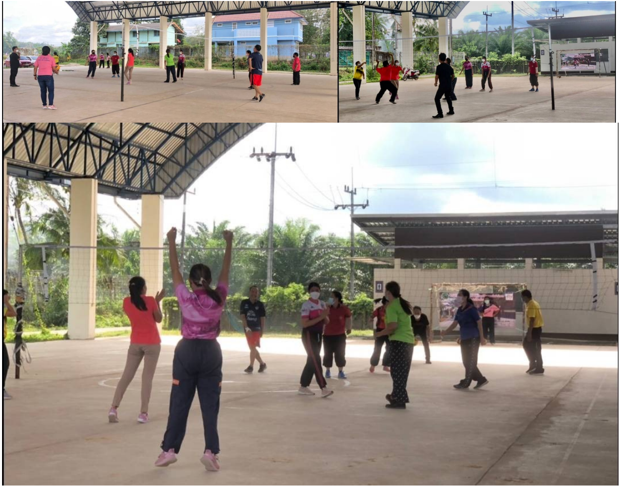
- ส่งผลการออกกำลังกายในแอป ก้าวทำใจ ของกรมอนามัย