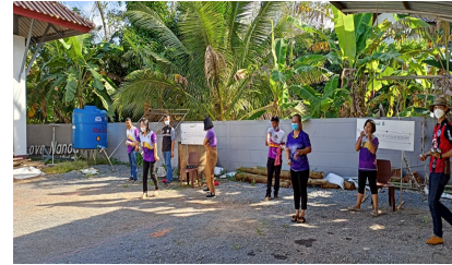
ผู้เข้าร่วมกิจกรรม