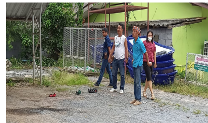
ผู้เข้าร่วมกิจกรรม