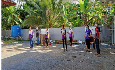
ผู้เข้าร่วมกิจกรรม