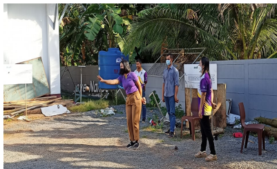
ผู้เข้าร่วมกิจกรรม