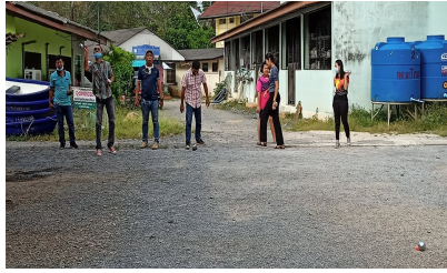
ผู้เข้าร่วมกิจกรรม