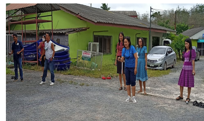
ผู้เข้าร่วมกิจกรรม