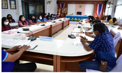
ผู้เข้าร่วมประชุม