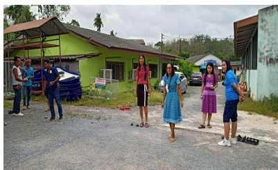
ผู้เข้าร่วมกิจกรรม