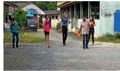
ผู้เข้าร่วมกิจกรรม