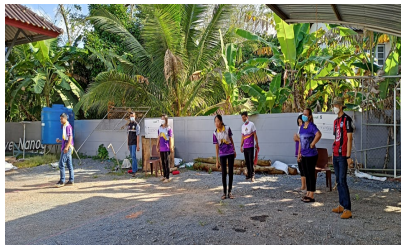
ผู้เข้าร่วมกิจกรรม