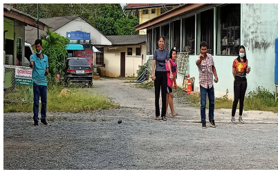
ผู้เข้าร่วมกิจกรรม