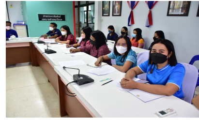
ผู้เข้าร่วมประชุม