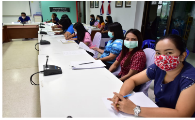
ผู้เข้าร่วมประชุม