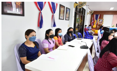
ผู้เข้าร่วมประชุมรับฟังคำชี้แจง