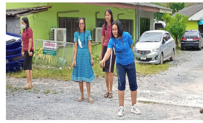
ผู้เข้าร่วมกิจกรรม