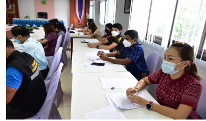
ผู้เข้าร่วมประชุมรับฟังคำชี้แจง