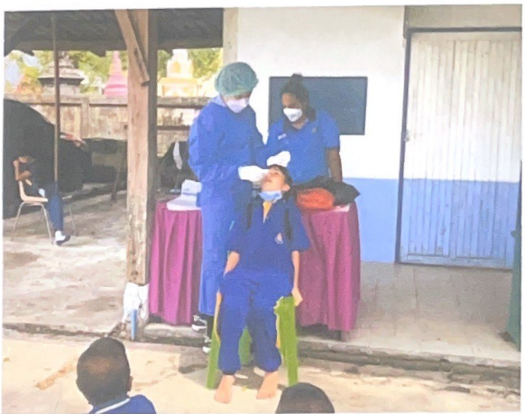
ตรวจคัดกรองนักเรียนและบุคลากรที่มีความเสี่ยงระหว่างเปิดภาคเรียน