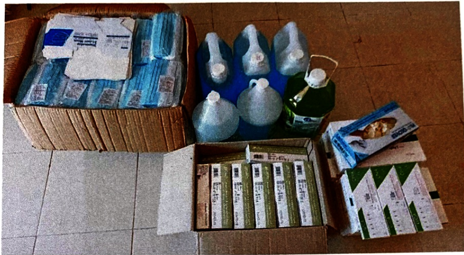
อุปกรณ์คัดกรอง หน้ากากอนามัย(แมส) ชุด ATK น้ำยาล้างมือ แอลกอฮอล์ ถุงมือยาง