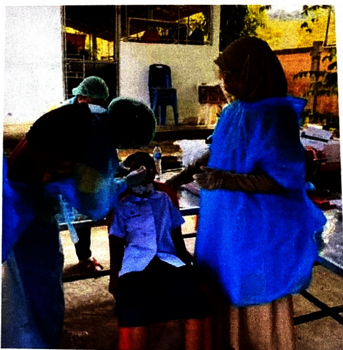
คัดกรอง ATK นักเรียน