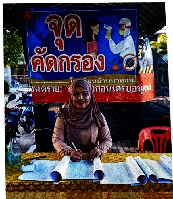
เครื่องมือวัดอุณหภูมิอินฟาเรด ล้างมือด้วยเจลแอลกอฮอล์ ป้ายไว้นิต