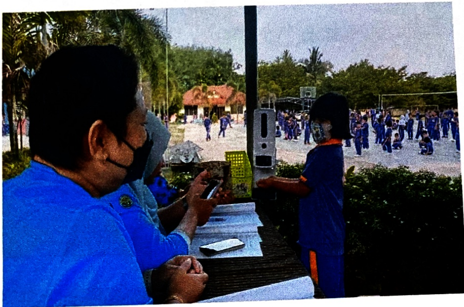
คัดกรองนักเรียนก่อนเข้าโรงเรียน ด้วยเครื่องมือคัดกรองวัดอุณหภูมิ ถ้าวัดด้วยเจลแอลกอฮอล์