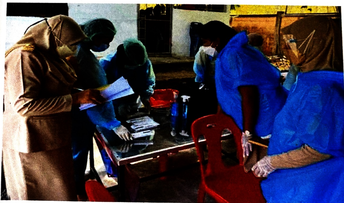
คัดกรอง ATK นักเรียน