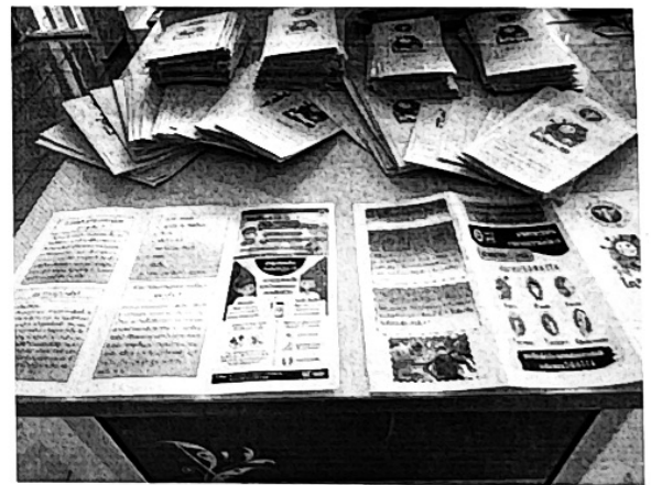
แผ่นพับความรู้การป้องกันโรคโควิด-๑๙