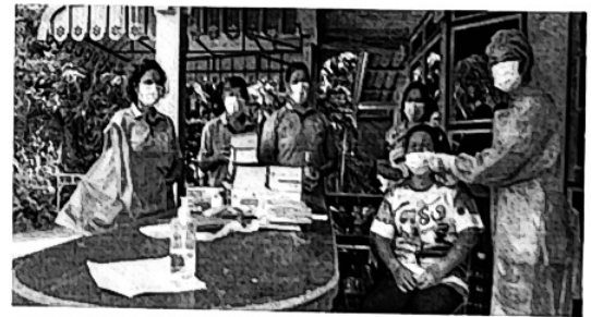
กิจกรรมคัดกรองกลุ่มเสี่ยง