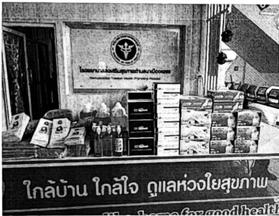
อุปกรณ์ในการคัดกรองและฝ้าระวัง

ภาพประกอบ โครงการป้องกัน ฝ้าระวังและควบคุมโรคโควิด-๑๙ ปีงบประมาณ ๒๕๖๕