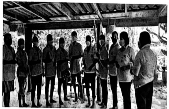
กิจกรรมรณรงค์ให้ความรู้และแจกแผ่นพับ