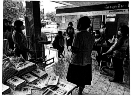
ชี้แจงเตรียมความพร้อมก่อนการคัดกรอง