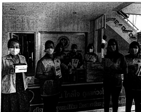
จัดเตรียมความพร้อมของอุปกรณ์ในการคัดกรองและฝ้าระวัง