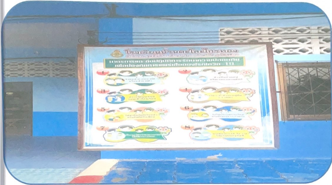
บอร์ดประชาสัมพันธ์เผยแพร่การให้ความรู้เกี่ยวกับ แนวทางการปฏิบัติเพื่อป้องกันโรค โควิด 19