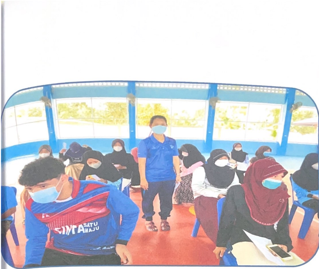
ทางโรงเรียนมีการคัดกรอง ตรวจผล ak ก่อนเปิดภาคเรียน