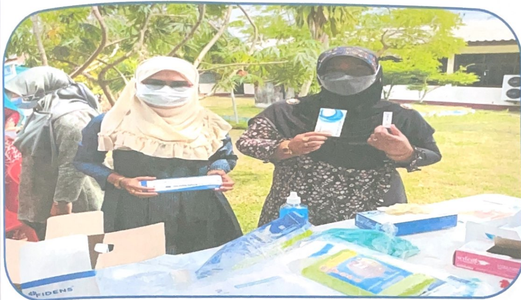
มีการเตรียมความพร้อม จัดซื้ออุปกรณ์ต่างๆที่จะนำมาใช้คัดกรอง เฝ้าระวัง ป้องกัน