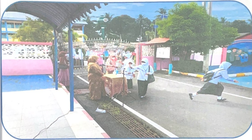
ทางโรงเรียนมีมาตรการเฝ้าระวังคัดกรองนักเรียนก่อนเข้าบริเวณโรงเรียน และบริการแจกหน้ากากและแอลกอฮอล์แก่ผู้ปกครอง