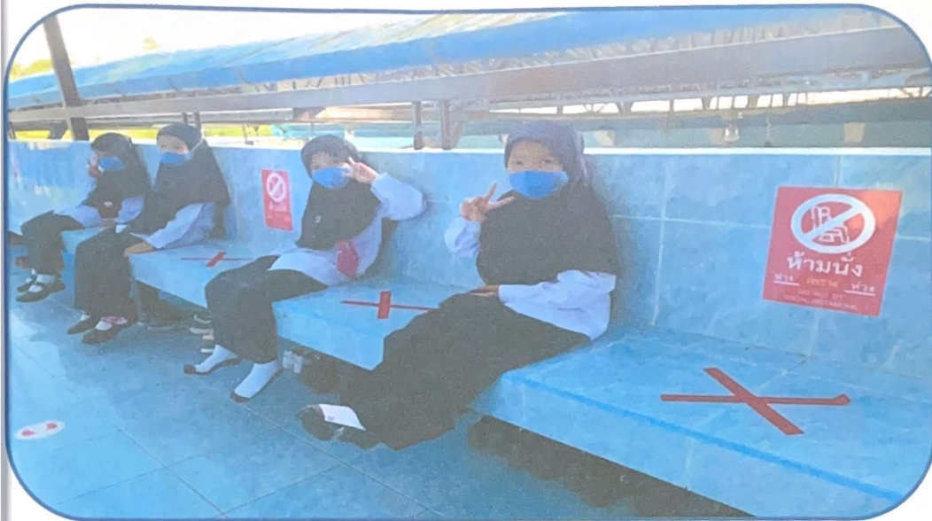
มีการให้อบรมให้ความรู้ เรื่อง วิธีการป้องกัน